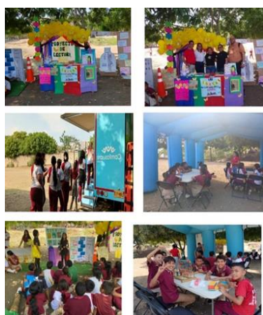
Estrategia 2: Desarrollar Habilidades Sociales

Nota. Las fotografías de las actividades desarrollar Habilidades Sociales.