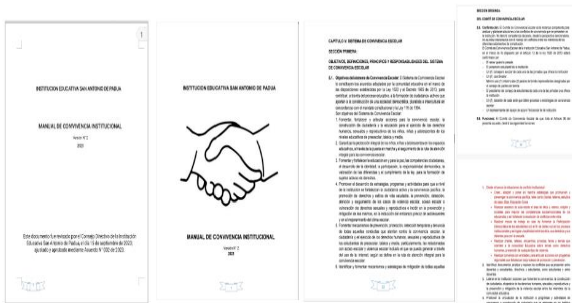
Estrategia 1: Líneas de Comunicación Abiertas y Asertivas

Nota. El Manual de Convivencia Institucional. Tomado de la Institución Educativa Intercultural San Antonio de Padua.