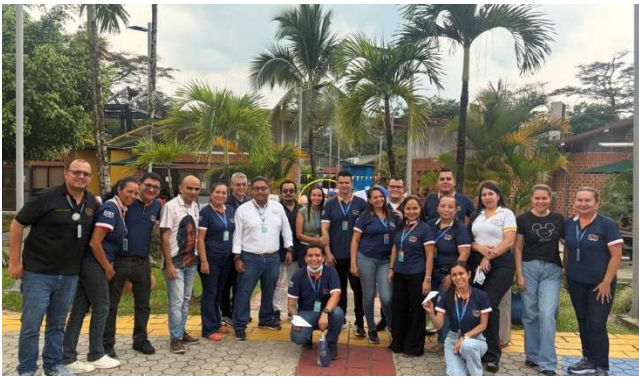
Equipo de tutores