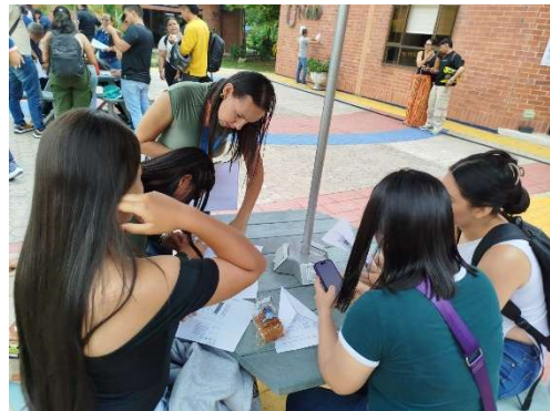
Fase 1. Registro de los participantes