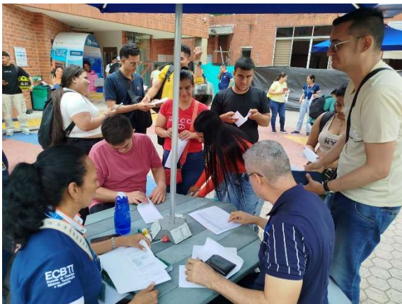
Fase 2 Entrega de material de trabajo a cada grupo