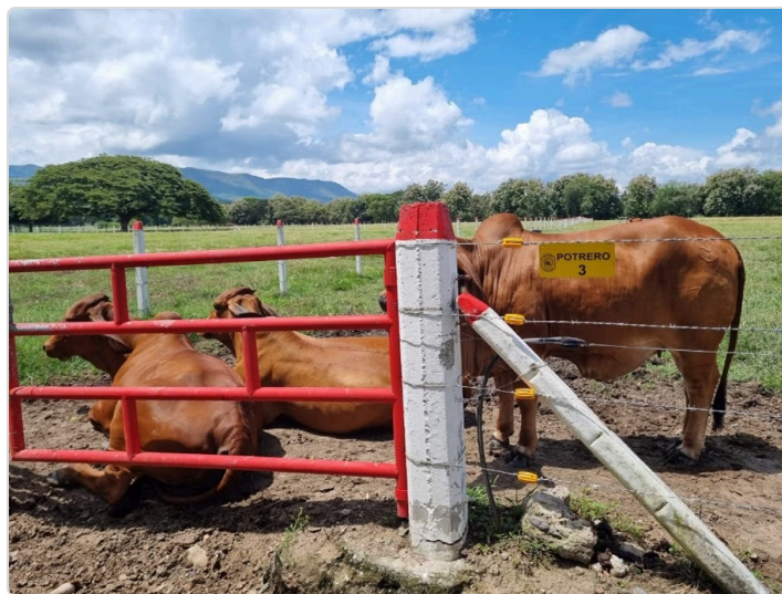
Figura 3. Potrero Finca Monterraló, Bienestar Animal.

El sistema de producción de bovinos para carne en la finca Monterraló en la vereda la mata del municipio de purificación, es de ciclo completo, la finca tiene en su inventario actual 69 bovinos, un toro cebú brahmán, 23 vacas, 9 novillas, 11 terneras, 16 toretes, 9 terneros, los bovinos que alcancen en el caso de los machos un paso superior a los 550 kilos y en hembras superior a 480 kilos, van para planta de beneficio animal, las hembras se mantiene una selección para cría, los propietarios de la finca Monterraló están interesados en acceder al programa de buenas prácticas pecuarias, ya que cuentan con muchos requisitos fundamentales, están certificados en hato libre de brucelosis y tuberculosis bovina, tienen los animales identificados, tienen el protocolo de ingreso de material genético, diligencian el registro ICA de los productos veterinarios, equipos para la reproducción y administración de medicamentos y biológicos veterinarios, almacenamiento y calidad de agua para consumo de animales, limpieza de áreas, equipos y utensilios, superficies y espacios disponibles, división de potreros identificados y fertilización, limpieza de los mismos, capacitación del personal, trabajan con principios de inocuidad, tienen buenas aguas naturales, arborización, implementación del sistema silvopastoril, buenas instalaciones de infraestructura, bienestar animal, sanidad animal, nutrición animal, un médico veterinario quien los asesora en su plan sanitario.