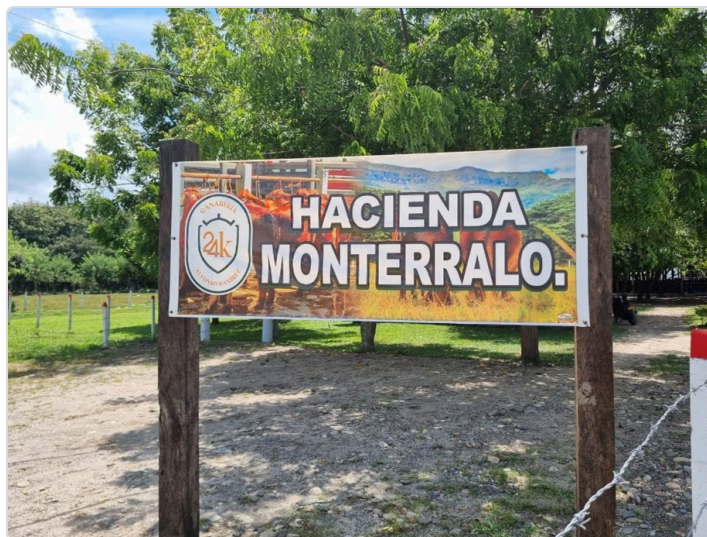
Figura 2. Ingreso Finca Monterraló.

Según la Resolución No. 068167 (20/05/2020) “Por medio de la cual se establecen los requisitos para obtener la certificación en Buenas Prácticas Ganaderas BPG en la producción de carne de bovinos y/o bufalinos: Que es de especial interés de los productores, como garantía adicional de control y aseguramiento de las condiciones sanitarias y de inocuidad en la producción primaria de la especie bovina y/o bufalina, la certificación de las buenas prácticas ganaderas para fortalecer el acceso de sus productos al mercado nacional e internacional. En este contexto los ganaderos deben propender en su producción primaria, desarrollar conductas con principios de inocuidad, para garantizar que los productos cárnicos de origen bovino sean limpios, libres de riesgos biológicos, físicos y químicos y no causen ningún daño al consumidor, si no que por el contrario su marmóreo, nivel nutricional integral sean de alta calidad, produciendo con responsabilidad social, ética profesional, pensando siempre en la excelencia agropecuaria.