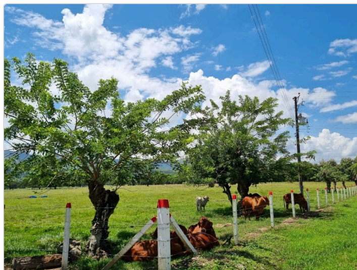
Figura 4. Bienestar Animal Finca Monterralo

Los principios de bienestar animal en la finca monterralo es buscar siempre la buena calidad de vida a los bovinos, para ofrecer un producto cárnico limpio, con principios de inocuidad alimentaria, de alta calidad para el consumo humano.