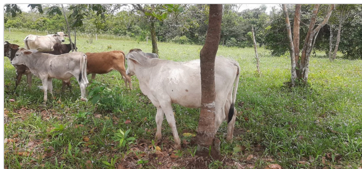
Figura 4. Se muestra un lote de terneras doble propósito de una finca vecina.

Se maneja ganado resultado de los cruces entre razas Brahman, Gyr, Girolando y otros cruces por su procedencia de fincas con líneas doble propósito. Cada lote de novillos (de 20 a 35) entra con un peso promedio de 200 kilos en etapa de destete, luego de un periodo de 12 a 18 meses se sacan al mercado con un peso promedio de 400 kilos, obteniendo así un aumento del 200%, si hablamos en dinero actualmente el total bruto de venta por lote anual estaría alrededor de $40.000.000 al año. Debido a la baja cantidad de animales las pérdidas por muerte o accidentes es baja o nula, las principales pérdidas están en la falta de ganancia de peso.