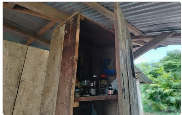
Figura 5. Disposición de productos veterinarios.

La finca no cuenta con registros ni un plan sanitario establecido, adopta los ciclos de vacunación contra fiebre Aftosa establecida por FEDEGAN y el Comité de Ganaderos del Meta; para desparasitar o administrar vitaminas o hacer cualquier otro procedimiento. Se usa Oxitetraciclina como antibiótico, Ivermectina, Doramectina o Levamisol para control de parásitos, se usa complejo B, Cobrex y multivitamínicos para las deficiencias, pero todo ello sin una formulación por profesional alguno, solo siguiendo consejos de distribuidores y vecinos.