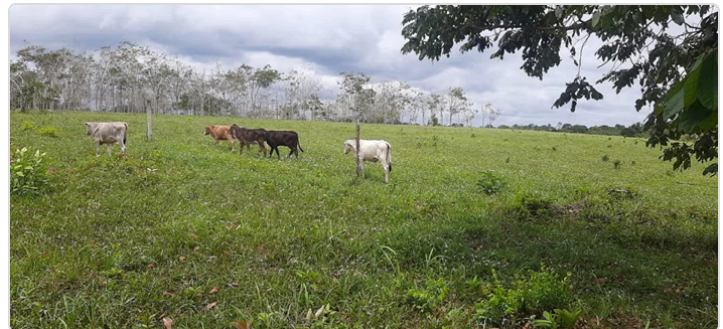
Figura 2. Panorámica del sistema productivo.

El manejo sanitario se basa en ciclos de vacunación obligatoria (según calendario del ICA mediante personal adscrito al Comité de Ganaderos del Meta) y controles de parásitos externos e internos de manera periódica cada tres meses o según la necesidad. Sin embargo, estas actividades se realizan sin la supervisión directa de un médico veterinario y sin registros sistemáticos que