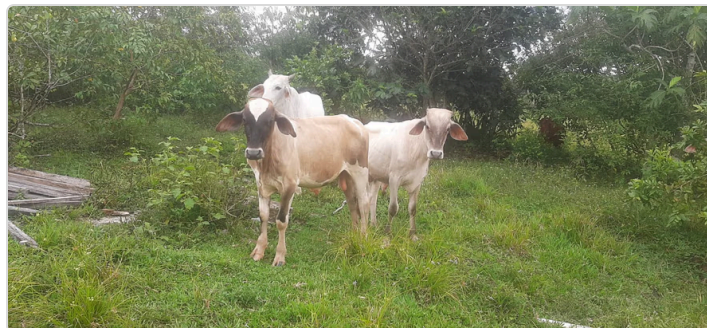
Figura 3. Estado corporal de los animales.

Los animales presentan poca masa muscular y una ganancia de peso diaria menor a 50 g, esto repercute en el tiempo requerido de ceba, su alimentación se basa únicamente en el pastoreo, adicionado con sales mineralizadas sin fórmula de un profesional. No se dispone de agua en bebederos, los animales deben ir a la fuente. En la finca no hay báscula lo cual dificulta llevar un control del peso.