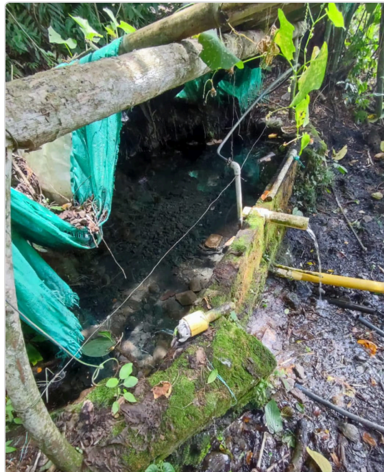
Figura 4. Apiario el Cerrito - fuente hídrica

La cosecha de miel y demás productos apícolas se realiza bajo condiciones higiénicas, utilizando equipos apropiados, materiales inocuos y procedimientos que minimizan el estrés de las colonias y la contaminación de los productos. Estas prácticas permiten obtener productos de alta calidad, inocuos y competitivos en el mercado regional.