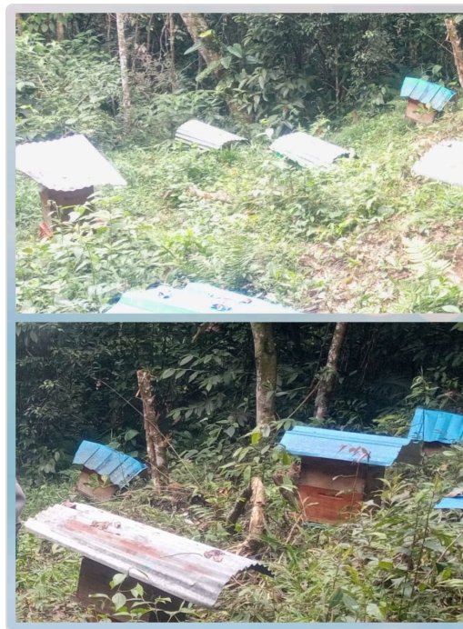
Figura 3. Apiario el Cerrito

El manejo sanitario se basa principalmente en la prevención, mediante inspecciones periódicas, monitoreo del estado de las colonias y aplicación de medidas de bioseguridad. No se utilizan rutinariamente medicamentos veterinarios, por lo que varios criterios de este componente se clasifican como no aplicables dentro de la lista de chequeo.