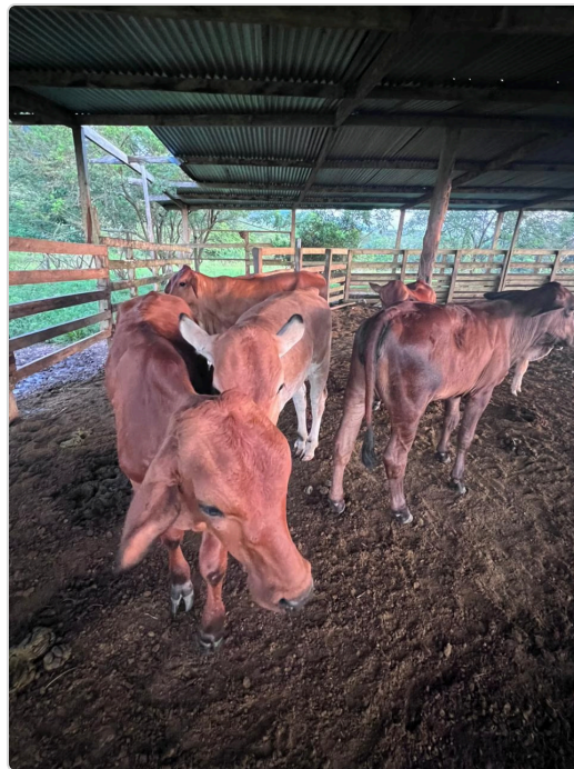
Figura 5. La muy buena condición corporal de los terneros.

Además, los bovinos presentan identificación básica que facilita algunas labores de manejo y control dentro de la finca. Sin embargo, se identificó la necesidad de fortalecer los registros sanitarios y productivos, especialmente en tratamientos, vacunaciones y controles preventivos, con el fin de mejorar la trazabilidad y el cumplimiento de las Buenas Prácticas Pecuarias.