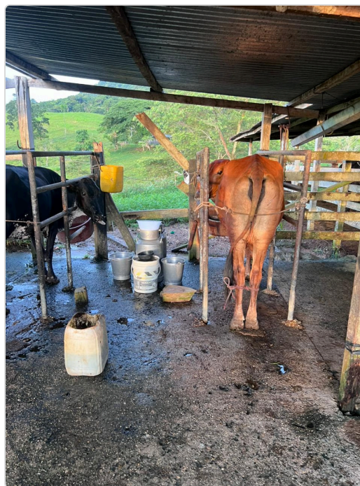
Figura 2. Area de ordeño manual.

Sin embargo, se identificaron algunas oportunidades de mejora relacionadas con el fortalecimiento de la infraestructura menor, tecnificación de ciertos procesos y optimización en la conservación de la leche. De igual manera, se recomienda continuar fortaleciendo las medidas de higiene, bioseguridad y control sanitario dentro de las instalaciones, con el fin de garantizar una mejor calidad e inocuidad del producto final.