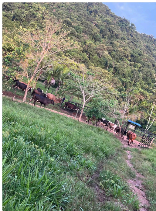
Figura 3. Area de pastoreo de los bovinos.

Durante la visita técnica se evidenció que el sistema productivo presenta condiciones favorables para el sostenimiento de los bovinos; sin embargo, se identificó la necesidad de continuar fortaleciendo algunos procesos relacionados con la suplementación nutricional y el manejo técnico de la alimentación, con el fin de mejorar la eficiencia productiva, el bienestar animal y la calidad de la leche obtenida.