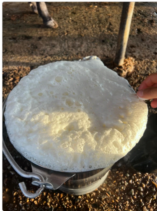
Figura 4. Producción de leche de la finca.

Durante la visita técnica se evidenciaron prácticas básicas relacionadas con el manejo sanitario, identificación animal y rutina de ordeño, permitiendo mantener la producción lechera en condiciones aceptables. Sin embargo, se identificaron oportunidades de mejora en aspectos como registros productivos, tecnificación de procesos y conservación de la leche, con el fin de fortalecer la eficiencia y competitividad de la finca.