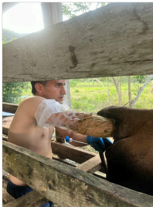
Figura 6. Inseminación artificial en la finca las delicias.

Durante la visita técnica se evidenció el manejo de vacas en producción, vacas horras y becerros, lo que demuestra la continuidad del ciclo reproductivo dentro de la finca. Además, el productor mantiene prácticas básicas de manejo animal orientadas al sostenimiento del sistema ganadero.