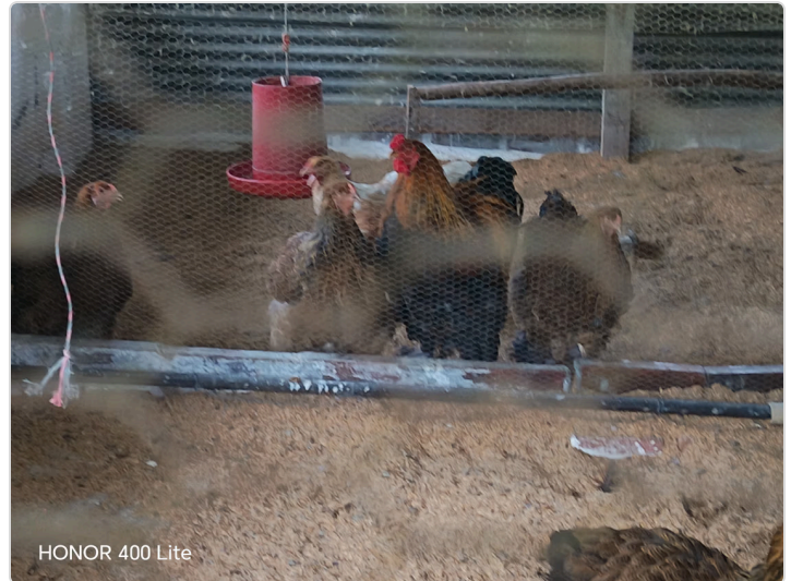
Figura 4. Unida productiva del señor Orlando Gomes.