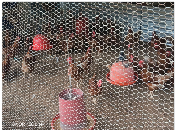
Figura 3. Galpón de la unidad productiva del señor Orlando Gómez.