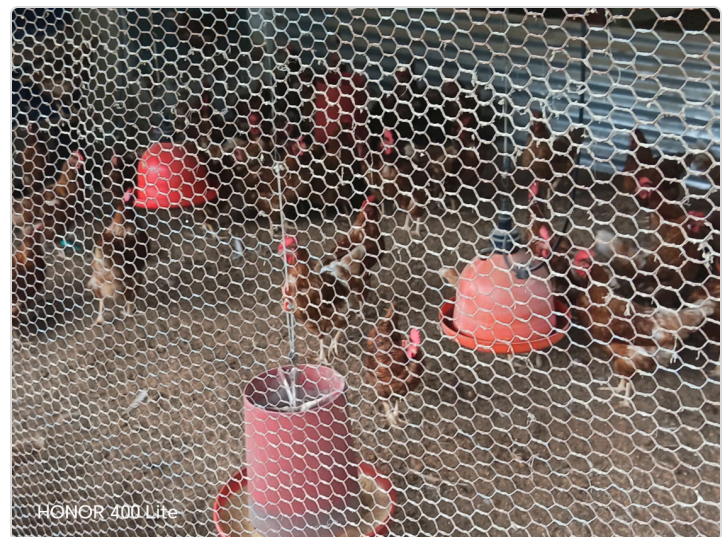
Figura 2. Unidad productiva del señor Orlando Gómez

Aunque faltan algunos ítems, en los cuales se debe trabajar, con las debidas mejoras se alcanzará la certificación ante el ICA. Esto permitirá mejorar la calidad e inocuidad del producto.