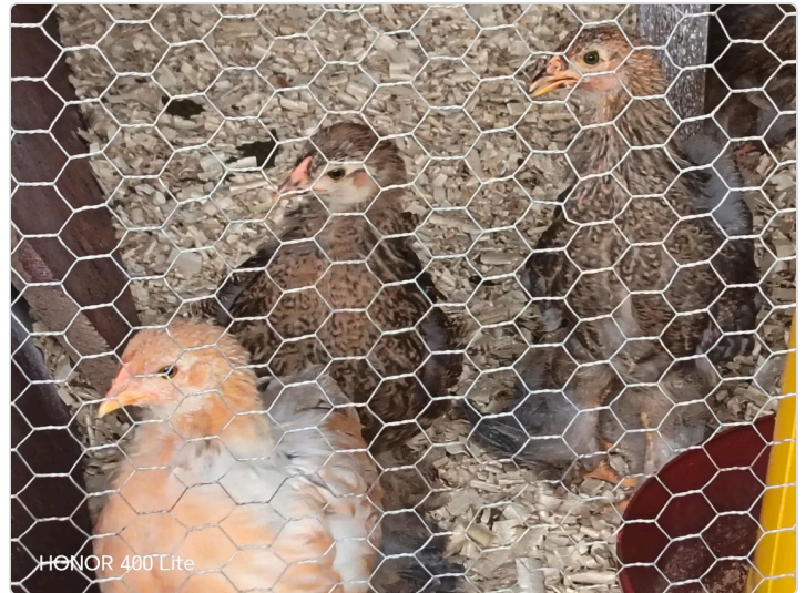
Figura 5. Galpón de levante, unidad productiva orlando gomes.

En esta unidad productiva se vela por el bienestar animal, garantizando la salud y bienestar animal, para obtener una excelente producción, garantizando así la inocuidad y calidad del producto final, en este caso huevo comercial.