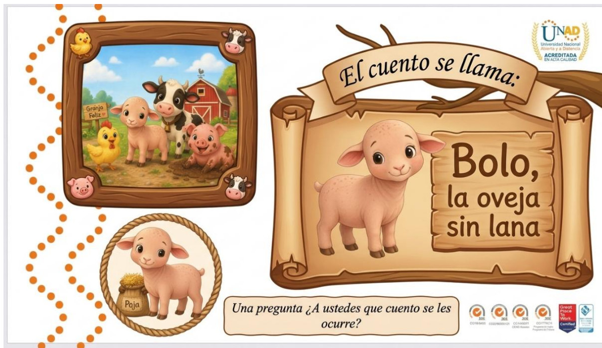
Imagen para que los estudiantes inicien su creatividad de construir el cuento

Nota. Estructura de la historia de Bolo.