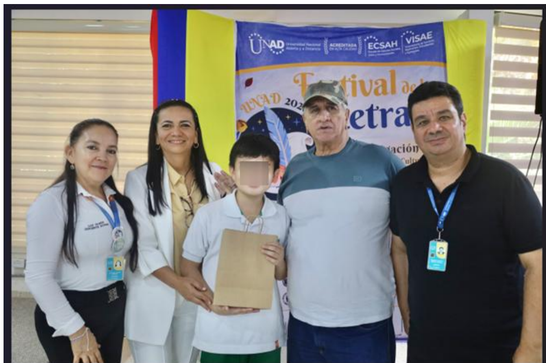
Foto premiación estudiante que realizo dos cuentos.