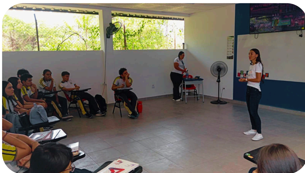
Figura 8. Registro fotográfico estudiante dinamizando la CIPAS

Estas estrategias permitieron alcanzar de manera satisfactoria los objetivos relacionados con el reconocimiento, la expresión y el manejo de las emociones en los estudiantes, utilizando herramientas artísticas y teatrales. Esto contribuyó a la alfabetización emocional, la autorregulación y el bienestar integral de la comunidad educativa. Especialmente, se aportó al bienestar del grado once, que inicialmente mostró tensiones debido a la presión académica, la presentación de pruebas ICFES y la toma de decisiones importantes sobre su futuro, promoviendo un espacio de acompañamiento y de resiliencia.