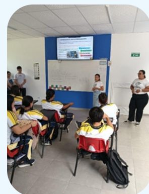
Figura 5. Registro fotográfico sesión 1