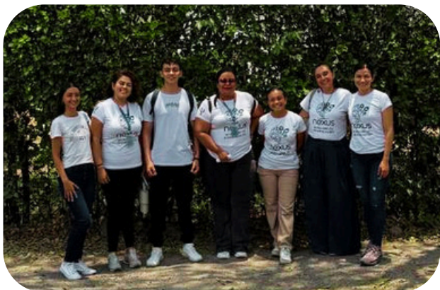
Figura 1. Docentes y estudiantes de la UNAD que lideran y acompañan el desarrollo de la CIPAS Territorial (2026).