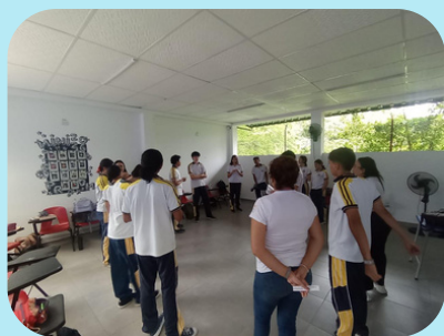
Figura 6. Registro fotográfico sesión 2

2- Facilitar a los estudiantes el dar un sentido narrativo a sus sensaciones físicas transformando el malestar en información útil para su vida. Con esto le dan voz a la emoción.