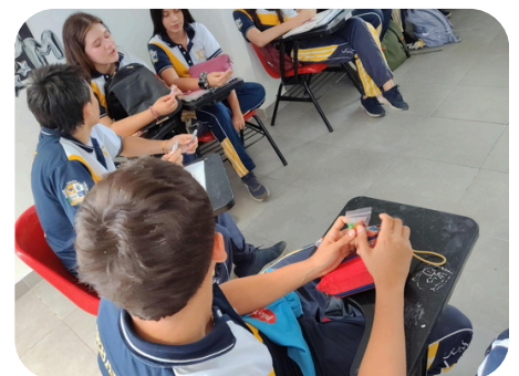
Figura 4. Registro de estudiantes participantes de la CIPAS