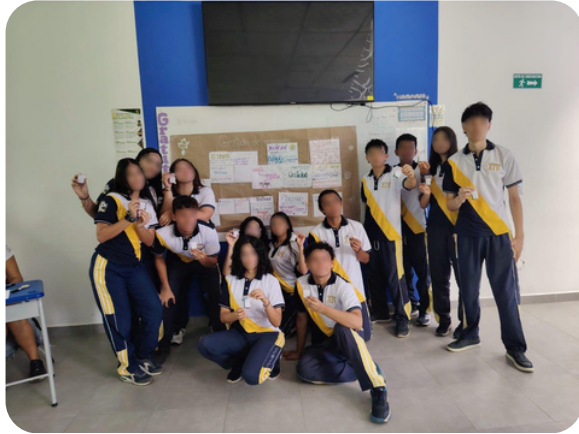
Figura 3. Registro de estudiantes participantes de la CIPAS