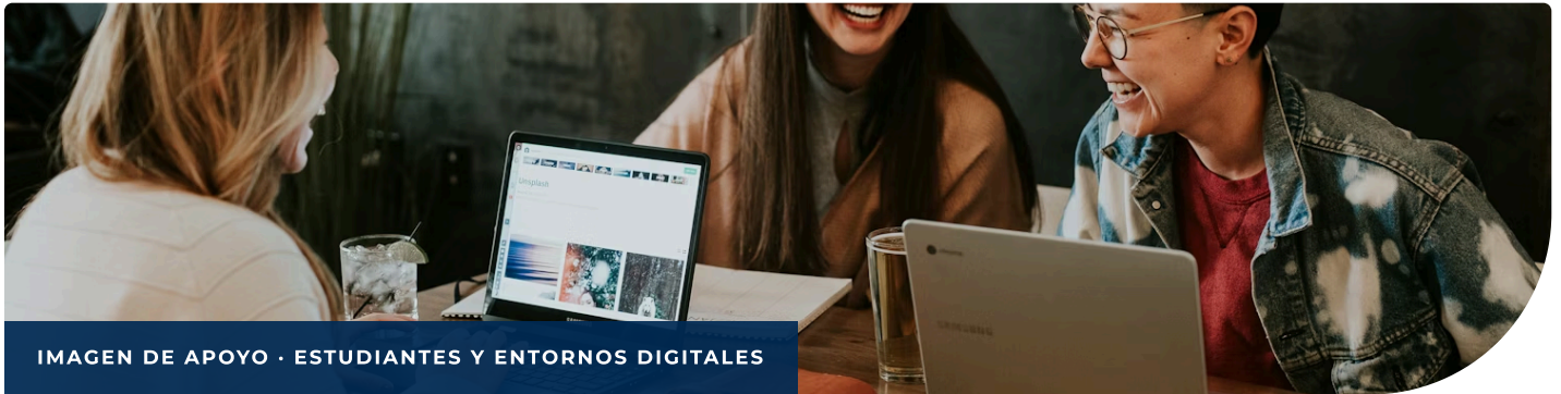
IMAGEN DE APOYO · ESTUDIANTES Y ENTORNOS DIGITALES

Cabe anotar que las redes sociales han impactado de manera positiva muchos aspectos de la vida académica y social. Entre ellos, se destaca la conexión instantánea con distintas audiencias, la posibilidad de compartir experiencias de manera inmediata y la aparición de nuevas estructuras lingüísticas que responden a los ritmos de la comunicación contemporánea.