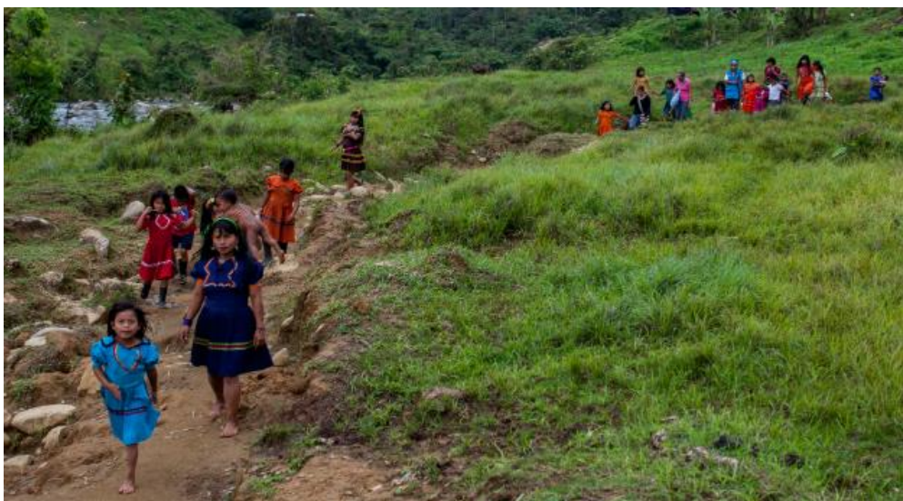
Figura 1. (Alto Baudó – Chocó, 2014).

Por todo lo anterior y por el aumento de los desplazamientos generalizados en el departamento, se vienen realizando reflexiones sobre el impacto que causa la situación de desplazamiento en la región y se ve la necesidad de analizar lo que pasa desde varias miradas. Existen algunos estudios por las Naciones unidas y por algunas organizaciones sociales que se han interesados en el tema.