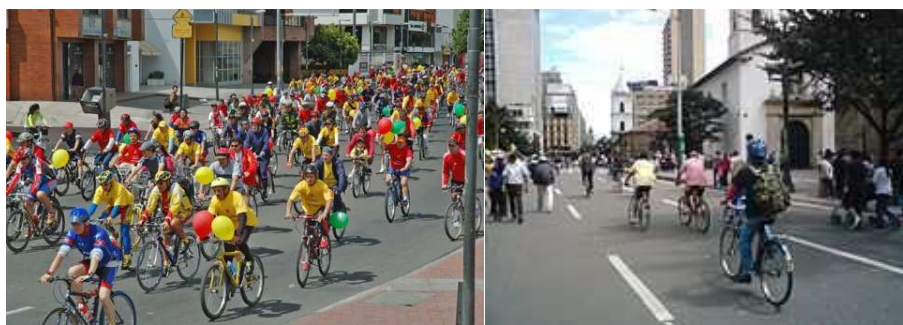
Fig. 6 y 7. Ciclo-vía en Bogotá D.C. (2011)

El circuito del norte, por su parte tomaba la calle 26 hasta la carrera 7, la carrera 7 de la calle 26 a la calle 116 y la calle 116, hasta la avenida Boyacá, que finalizaba al norte en la calle 127 y al sur en el parque El Tunal. Adicionalmente la carrera 30 desde la Autopista sur hasta la calle 26 y la carrera 50 desde la Autopista Sur hasta la Avenida Américas. Aclarando que el circuito conectó los puntos de Recreo vía ya existentes.