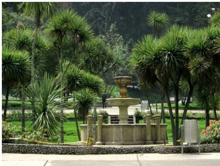
Fig. 10. La Fuente – Parque Nacional Enrique Olaya Herrera, Bogotá

El Parque Nacional Enrique Olaya Herrera, También llamado “Pulmón de Bogotá”, fue inaugurado en 1934 y es el segundo más antiguo de la ciudad. Sus 283 hectáreas traen consigo una gran diversidad de actividades.