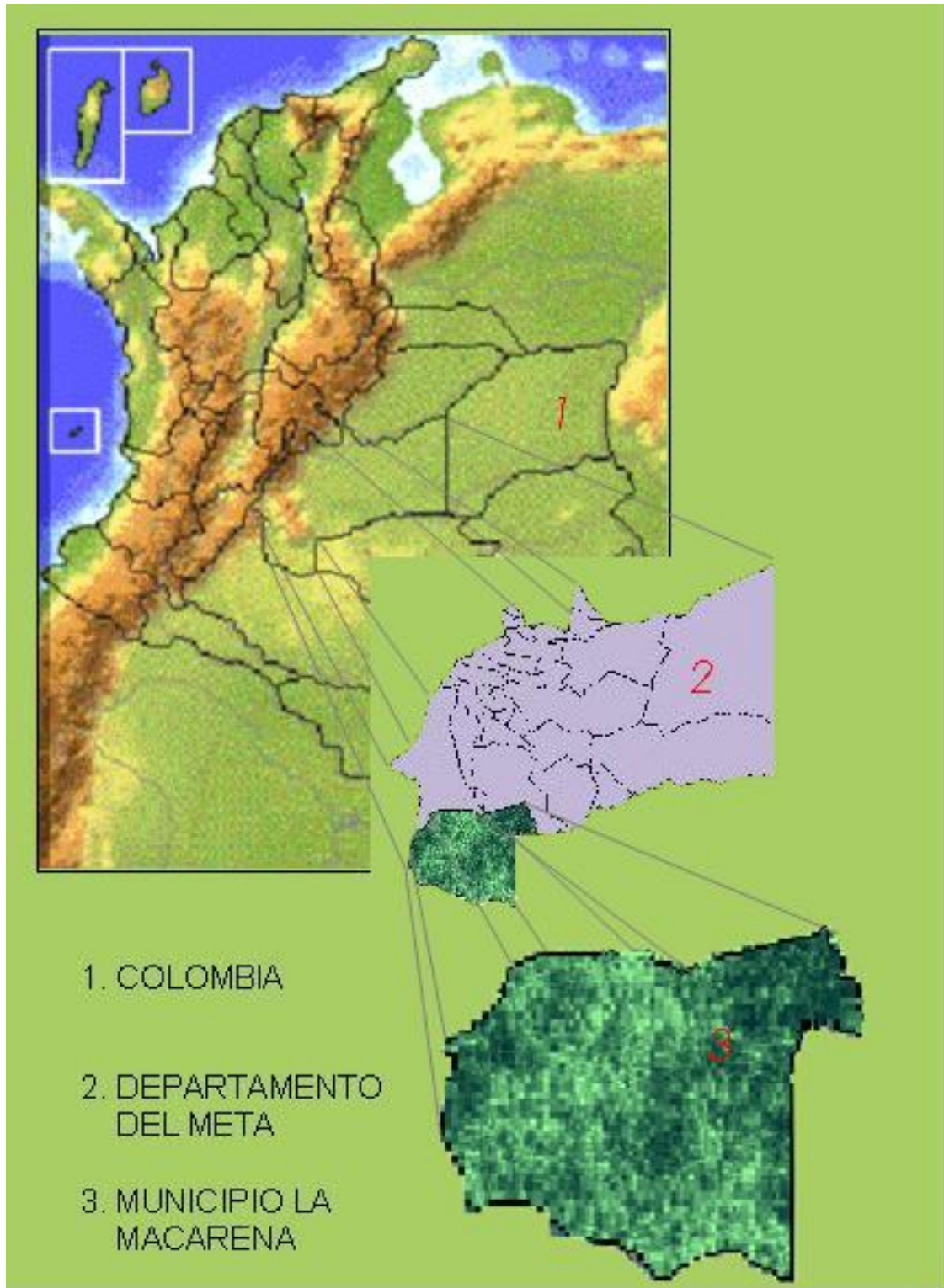
Figura No. 2