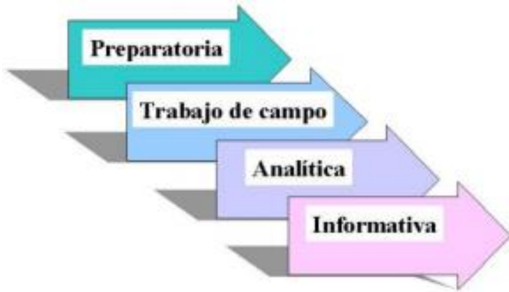
Figura No. 3