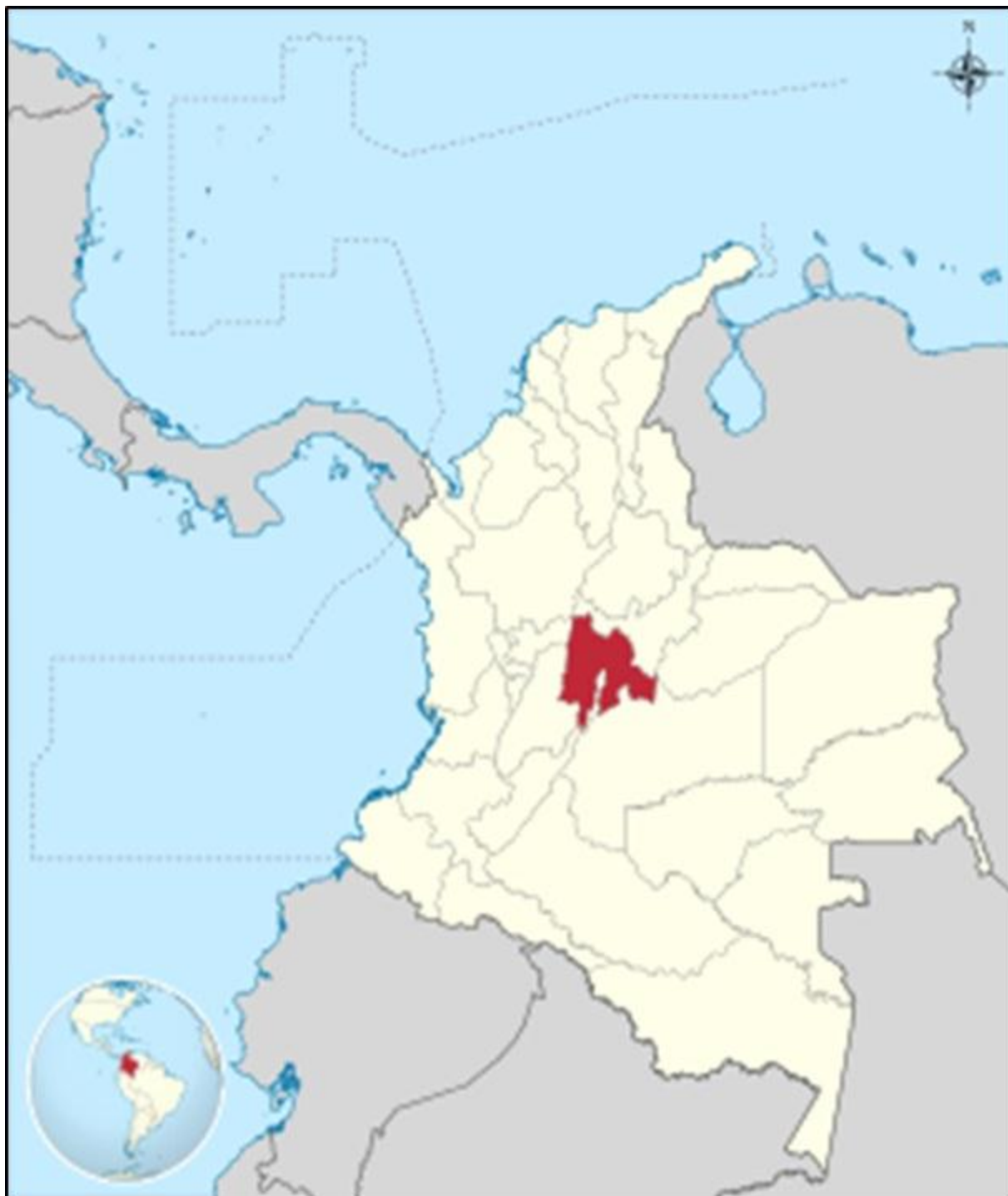
Figura 1. Mapa Situacional; País: Colombia; Departamento: Cundinamarca