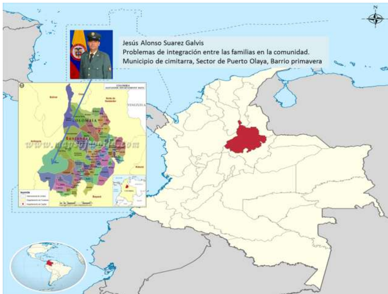
Suárez, J.(2017). Mapa situacional Departamento de Santander Municipio de Cimitarra. [Mapa].