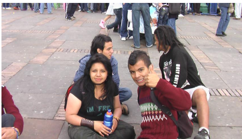
Figura No 6. Jóvenes co – fundadores de la Escuela Juvenil de arte Social “Videos y Rollos”.

con múltiples esfuerzos. Aunque el apoyo era pequeño, fue significativo, para entablar una relación que posteriormente fortalecería una confianza, que llevó a que hacia mediados de los noventa, CODEC, gestionara el proyecto “JORNADA ALTERNA”, con el fin de proseguir con los niños y niñas, egresados del Jardín Artístico La Escuelita, que habían ingresado ya al nivel de primaria, la formación en arte, expresión y pensamiento crítico y creativo.