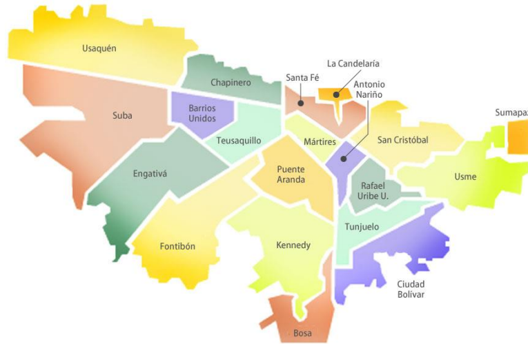
Figura No 1. Mapa de Bogotá, dividido por localidades.

Para efectos administrativos, la localidad de Bosa, está dividida en 5 Unidades de Planeamiento Zonal. Tintal Sur, El Porvenir, Bosa Occidental, Bosa Central y Apogeo. Bosa Occidental es la U.P.Z. más grande, debido a que desde esta, se irradió el poblamiento de la localidad. En ella se encuentran las construcciones más antiguas, alrededor del parque fundacional, en el costado sur está la iglesia en materiales como piedra y madera. En los costados oriental y occidental, hay colegios, que al igual que todo el conjunto arquitectónico, conservan un estilo colonial. Al norte está la alcaldía, desde la cual se imparten los lineamientos administrativos de la localidad.