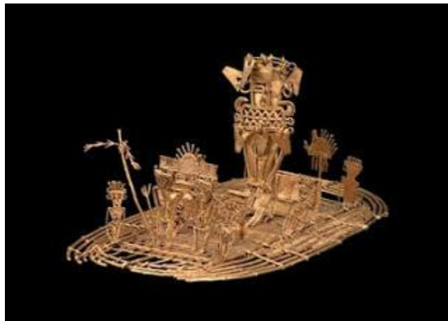
Figura No 3. Balsa Muisca, obra de orfebrería, hecha en oro en aleación con otros minerales.

Por muchos siglos, antes de la llegada de los europeos, Bosa, es uno de los principales cacicazgos, que mantiene un comercio nutrido con Bacatá, Engativá, Zipaquirá, entre otros, constituyendo la fortaleza de la nación Muisca, que a su vez, comercia con los pueblos del valle del Magdalena, Panches y Pijaos. Estos, necesitan la sal de las salinas de Nemocón y Zipaquirá, mientras que los Muisca, el oro y el algodón, para la fabricación de las prendas de vestir. El frío imperante en la sabana, sobre todo en épocas de lluvia, convierte a los Muisca en tejedores expertos, hasta el punto en que hoy todavía en los museos de arqueología, se pueden observar piezas de tejidos, con 20 y más siglos de antigüedad, en