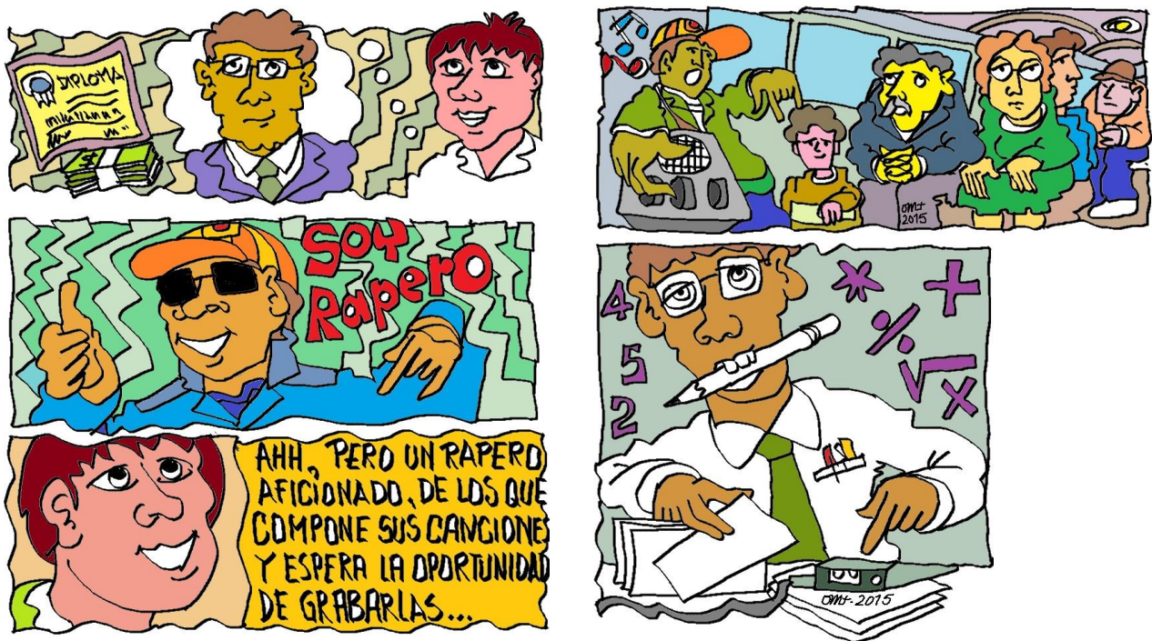
Figura No 4. Materiales gráficos que acompañan cada sesión de la Catedra de Derechos.

Cada aporte puesto en la red, va disponer de materiales audiovisuales, como historietas, comics, videos, animaciones, que van a acercar al joven usuario, a realidades que le son más cercanas que las representadas en un documento escrito, dado su escaso hábito de lectura de textos, pero sí de imágenes.