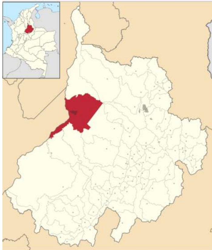
Figura 3 Ubicación de la ciudad de Barrancabermeja al interior del departamento de Santander, Colombia. Mapa de Shadowxfox.

Colombia 4 y aunque la temperatura promedio es de 27.9°C esta puede aumentar durante el año hasta 39.4 grado centígrados. La población que hace parte de esta comunidad posee como principales vocaciones económicas evidenciadas la artesanal, la pesca y la comercial, pero en su gran mayoría son empleados, en parte, del área de la explotación petrolera que tiene sede importante en la ciudad aunque también se debe mencionar que un buen número de los integrantes de esta comunidad se desempeña en labores de comercio formal, finalmente algunos se desempeñan en trabajos informales y otros se encuentran desempleados.