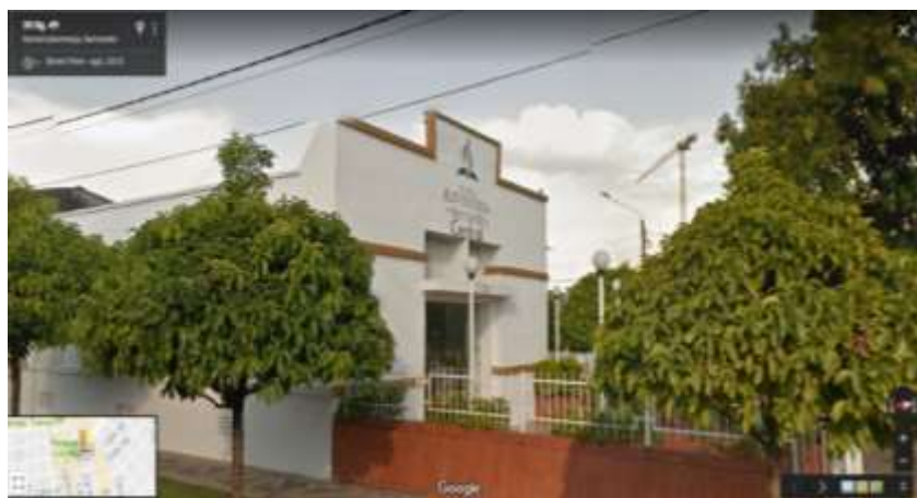
Figura 1 Templo Adventista Central de la ciudad de Barrancabermeja, Santander en Google Maps.