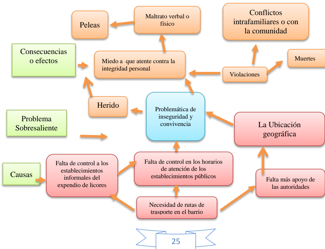
Gráfica 1 Árbol De Problemas: