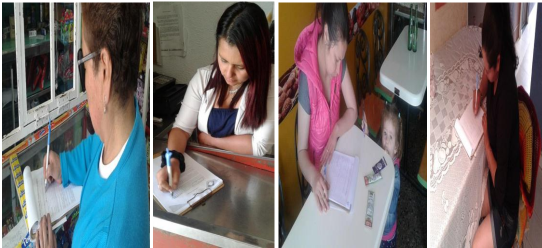
Descripción de fotografías: 11 de junio de 2017, señoras madres de familia residentes del barrio Jordán de la ciudad de Tunja, firmando el consentimiento informado para la realización de las actividades con conocimiento del proceso a realizar en el diplomado desarrollo humano y familia.

circunvecinos que no necesariamente son habitantes del barrio el Jordán del municipio de Tunja pero que también se ven afectados por esta situación, además considerando el desarrollo de este proyecto podemos decir que se beneficiara la ciudadanía en general ya que al mitigar los actos delincuenciales que se vienen presentando disminuye el índice de criminalidad que es una de las problemáticas que se presentan con más repercusión en los diferentes sectores de la ciudad.