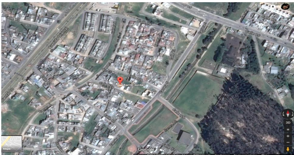
Barrió Jordán ubicado en la ciudad de Tunja en el departamento de Boyacá, limita con los barrios sol de oriente, san Antonio, Bachue, san Laureano, Avenida oriental 10, es muy característico y conocido por los habitantes por estar la licorera de Boyacá, imagen extraída del satélite buscada a través del buscador de Google .