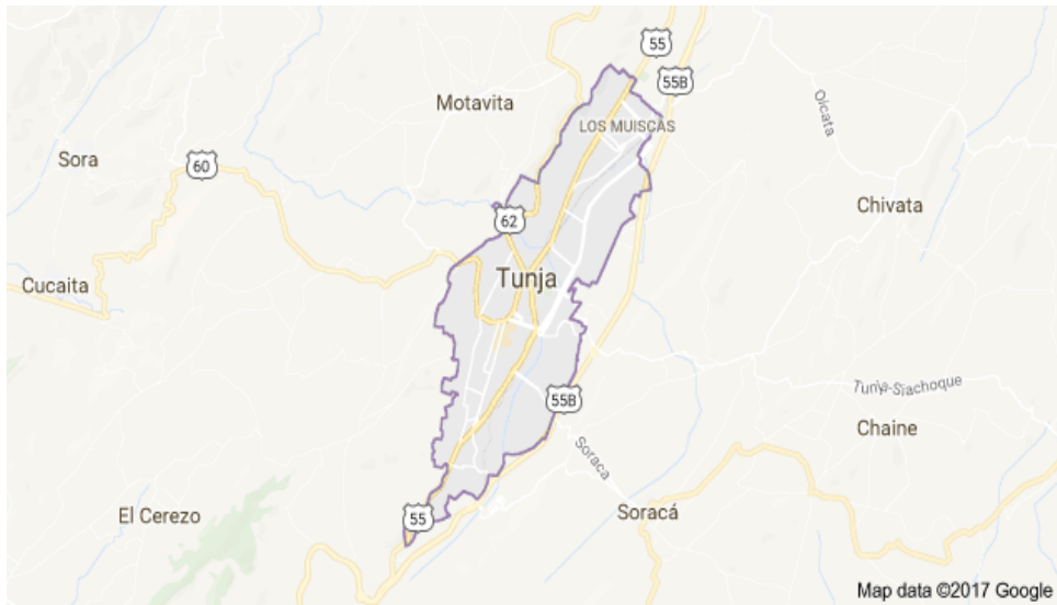
Mapa de la ciudad de tunja (Boyacá) y limita con municipios evidenciados en la imagen extraída de maps de Google 2017.