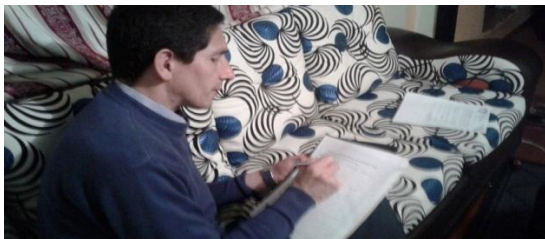
Foto de encuentro el 27 de junio a las 10:00 pm en la casa ubicada en la carrera 6-7c-24 con el presidente de la junta comunal del barrio Jordán aplicando el instrumento de recolección de datos y el consentimiento informado para el proceso a desarrollarse con la comunidad. Además de colocar al tanto de la actividad que se va a desarrollar con los participantes seleccionados.