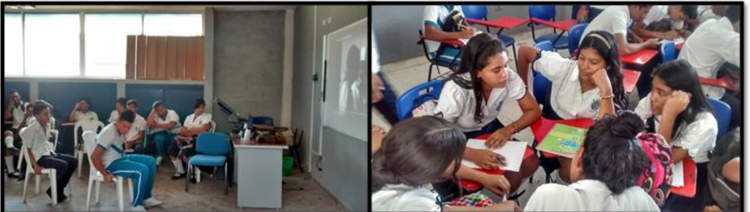
Fotos de la evidencia de la entrevista. (Instrumentos 2: Entrevista)