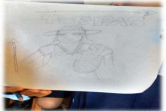
Fotos de la evidencia del dibujo. (Instrumentos 3: (técnica cualitativa por medio de un dibujo).)