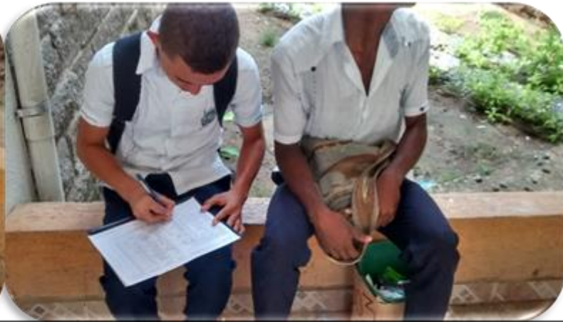
Fotos de la evidencia del censo realizado. (Instrumentos: la observación)