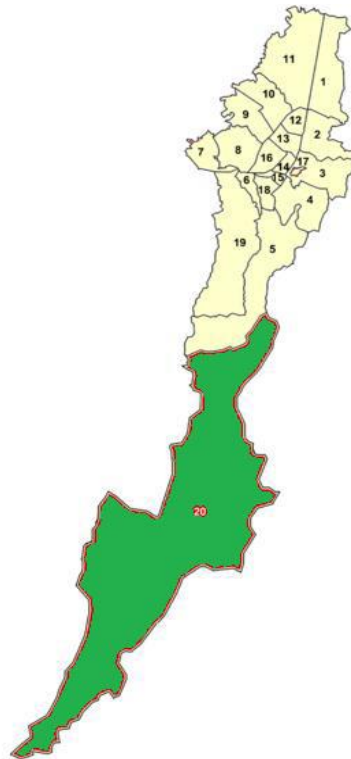
Ilustración 4 Mapa de Bogotá y sus localidades