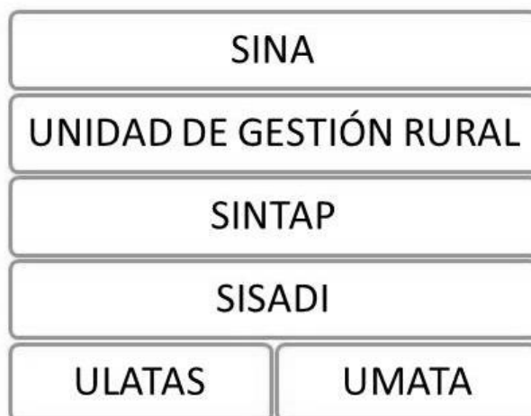
Ilustración 1 Nivelación Institucional Nacional al Distrital.

Agropecuaria) en las localidades de Sumapaz, Usme, Ciudad Bolívar, Chapinero y Santa Fé y en 1996 se crea el SISADI (Sistema Agropecuario Distrital); todas las anteriores instituciones dependientes del SINA (Sistema nacional de Ambiente) cuyo principio es el desarrollo ambiental sostenible. Adicionalmente y al mismo nivel de las ULATAS encontramos las UMATAS (Unidades Municipales de Asistencia Técnica Agropecuaria), su fin es asistir pequeños productores en temas técnicos y de transferencia tecnológica relacionados con la defensa del medio ambiente y la protección de recursos naturales renovables; mientras los primeros se encargan de desarrollar Planes Operativos anuales (POA) relacionados con temas productivos.