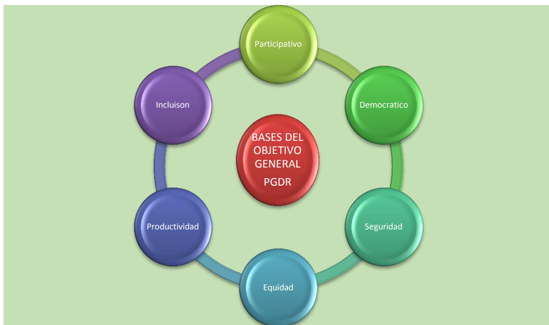
Ilustración 4. Aspectos bases del objetivo general del PGDR

El objetivo general del PGDR encierra los aspectos más importantes abordar para asegurar el mejoramiento de las condiciones sociales, ambientales y económicas de esta población que desempeña un papel fundamental para el abastecimiento de alimento para la ciudad y el cuidado del entorno ambiental de estas zonas.