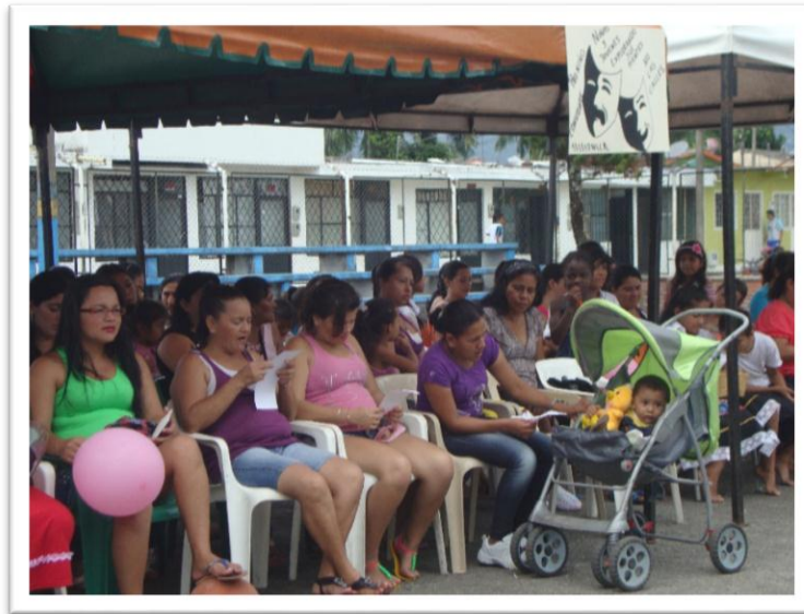
Figura 1. Fotografía Reunión padres de familia Catedra de la paz.