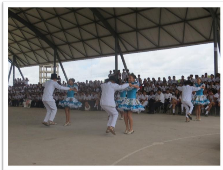
Figura 2. Representaciones culturales como propuesta fundamental para la superación y olvido de la guerra. Nuevos comienzos