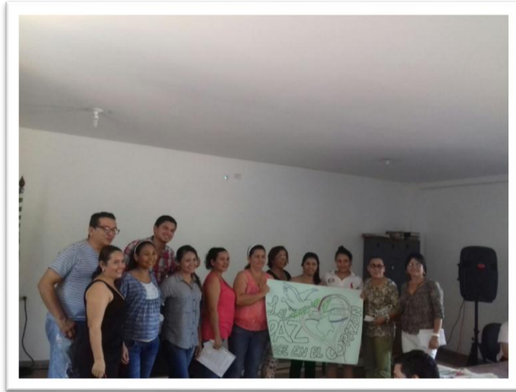
Figura 3. Conversatorio Docentes de la I.E Jorge Eliecer Gaitán en torno al papel del docente y de la escuela como formadores y forjadores de Paz.