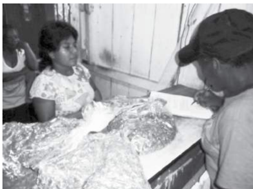
Fotografía 6. Entrega de semilla de cacao IMC-67 en la vereda El Placer (Dagua).

El proyecto privilegió la entrega de semillas en lugar de la plántula (Fotografía 6), dejando a los agricultores que realizaran la injertación; lo que puede ocasionar que algunos beneficiarios lo dejen crecer sin injertar, produciendo un cacao de aroma amazónico caracterizado por su sabor amargo.