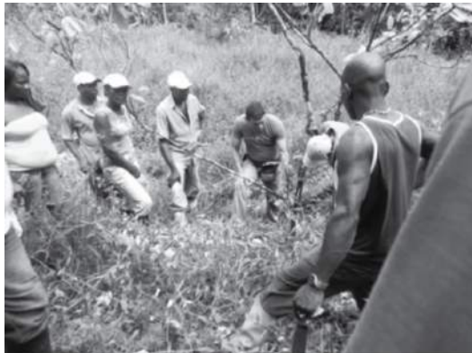
Fotografía 7. Práctica de injertación en La Gloria (Buenaventura).

Esta propuesta tecnológica depende del desarrollo de habilidades de injertación, las cuales se observaron en algunos beneficiarios de las veredas de Dagua y Bajo Calima. El método de injertación recomendado por facilidad y altas posibilidades de éxito fue el de aproximación lateral (corte limpio al costado a vareta de 2 yemas y patrón, unido con sintelita durante 15 a 25 días). El desarrollo de esta habilidad solo se realizó teóricamente y en una finca donde asistieron 15 beneficiarios (Fotografía 7), esto plantea dificultades para hacer duradera esta habilidad en el repertorio de prácticas de los beneficiarios, ya que son comunidades de practicantes con tradición oral, por lo que se afina esta técnica repitiéndola y haciendo encuentros agricultor-agricultor.