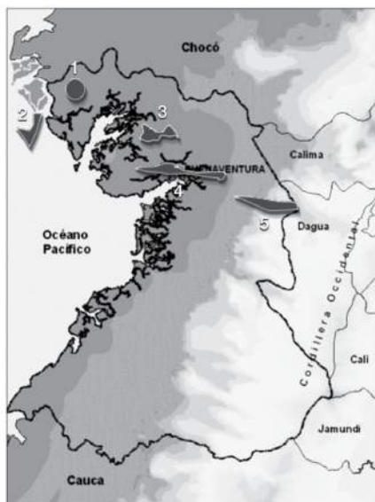
Figura 2. Localización de los sitios de intervención del proyecto.

Los participantes de la experiencia de cacao se localizan en los municipios de Buenaventura (6.297 km 2 , 3° 53' 35" N y 74° 4' 10" W) y Dagua (3° 38' 47" N y 76° 41' 30" W), en la margen izquierda de la cordillera occidental y en la costa pacífica del departamento del Valle del Cauca-Colombia (Figura 2). El municipio de Buenaventura se encuentra situado en la región del Chocó biográfico.