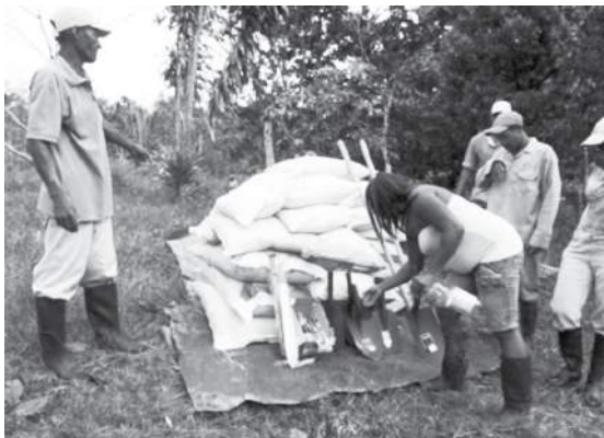
Fotografía 8. Entrega de insumos y herramientas en la vereda La Gloria (Buenaventura).

En este sentido sería importante examinar la contribución que realiza la naturaleza a la disponibilidad de nutrientes para el cacao y la que podría complementarse con el manejo humano del cacaotal, teniendo en cuenta la pluriactividad de los beneficiarios y la prioridad que tienen otras actividades generadoras de ingresos respecto a la producción agrícola.