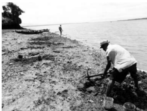
Fotografía 1. Recolección de moluscos, por parte de los participantes en el proyecto, en la zona mareña.

En el caso de las veredas de la zona baja de Buenaventura (zona mareña, Tabla 2), la fuente de proteína procede de la pesca, recolección de moluscos y caza (Fotografía 1), y aunque se carece de información sobre la participación de estas fuentes en la dieta alimentaria, se estaría desdibujando el supuesto de inseguridad alimentaria para todas las veredas del proyecto. En este sentido, la categoría de seguridad alimentaria pareciera ser muy abstracta en la formulación y medición de los efectos buscados por el proyecto.