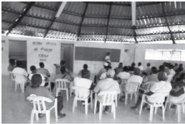
Fotografía 9. Capacitación realizada por el proyecto en Bajo Calima (Buenaventura).

Las capacitaciones fueron intensivas (4 temas en media jornada) (Fotografía 9), no se programaron prácticas en campo y no se construyó la línea de base para la evaluación ex ante y ex post que midiera el impacto del proyecto. Igualmente al no ser posible visitar las parcelas de los beneficiarios para conocer el estado real de los cacaotales y determinar la existencia de 92 ha que necesitaban fortalecerse, ni tampoco verificar que se hubieran establecido con el proyecto las 78 ha proyectadas.