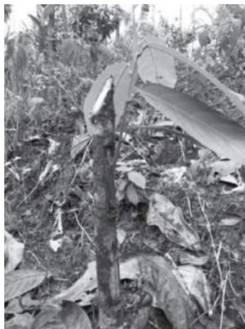
Fotografía 4. Injertos de cacao en Bajo Calima (Buenaventura).

En la zona mareña (veredas Puerto España, Ladrilleros, La Plata, Bahía Malaga y Bajo Potedó) y en el antiguo corregimiento 8 (veredas, Agua Clara, Guaimia, San Marcos, Zacarías, Sabaletas, Llano Bajo y Potedó) la producción de cacao se destina para el autoconsumo y no se generan excedentes para los mercados. Las variedades son rústicas y adaptadas a las condiciones climáticas y de suelo predominantes en la región; el manejo se limita a rozar las hierbas acompañantes y a la recolección. Recientemente en el Bajo Calima se están adoptando técnicas de injertación (Fotografía 4) y ajustando los arreglos de los árboles asociados al cacao.