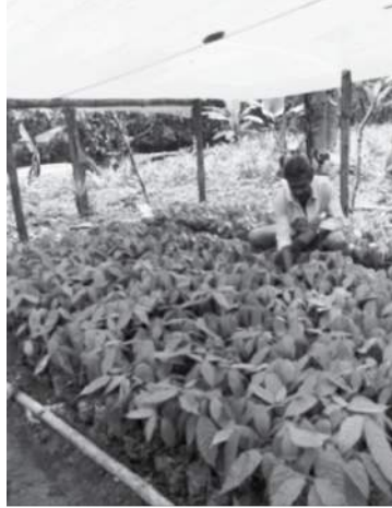
Fotografía 10. Viverista y material genético local en la vereda el Cauchal (Dagua).

Para las técnicas claves (podas e injertación) que se desean difundir con el proyecto, sería crucial reconocer a los agricultores que las manejan con destreza y documentar las maneras como ellos las adoptaron y adaptaron, con el fin de desarrollar las metodologías de difusión de las técnicas, las cuales se complementarían con experiencias en campo orientadas por estos agricultores expertos.