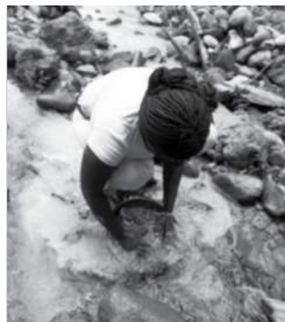
Fotografías 2 y 3.

Extracción de madera en Bajo Calima y minería artesanal en Agua Clara (Buenaventura).