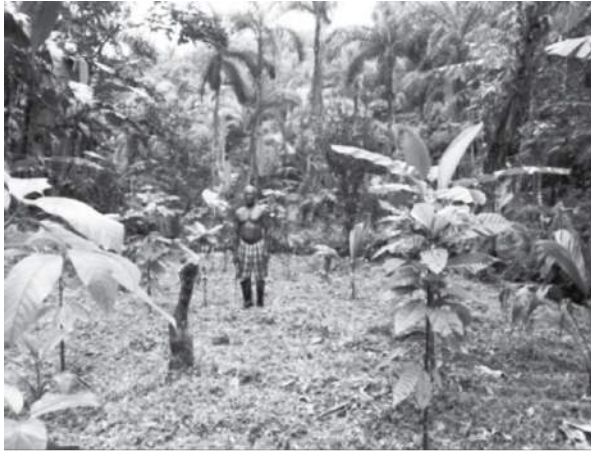
Fotografía 5. Cacao asociado con chontaduro, plátano y árboles. Vereda Cauchal (Dagua).

Al considerar los referentes de rendimiento en las localidades de Buenaventura y Dagua las informaciones son imprecisas pero lo sitúan en el rango de 50 a 150 kg/ha, los cuales estarían muy distantes de la clasificación que referencia la Federación de Cacaoteros. Esta institución agrupa, al menos, en dos categorías a los agricultores: tradicionales y tecnificados; en los primeros considera los cacaotales con rendimientos de 400 a 500 kg/ha/año y densidades de siembra de 600 a 700 árboles/ha; mientras que en los agroforestales tecnificados, 1.500 kg/ha y más de 1.000 árboles/ha (Rojas, 2010). Desde esta perspectiva la actividad cacaotera de esta región del Pacífico tendría que someterse, según Fedecacao, a intervenciones técnicas que la saquen de este umbral de atraso técnico. Sin embargo, sería pertinente adelantar seguimientos frecuentes que generen informaciones más precisas sobre los rendimientos y que examinen las condiciones culturales de la actividad cacaotera y los referentes pertinentes para los rendimientos de cacao en condiciones de pluviselva y de pluriactividad de las familias.