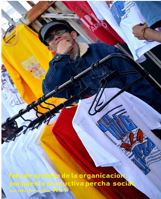
foto de archivo de la organización: por puesto productiva percha social, septiembre de 2017

se distribuye el recurso tratando de favorecer a los integrantes en mayor nivel de vulnerabilidad o con necesidades inaplazables, como el caso de padres y madres de familia, jóvenes universitarios, entre otros.