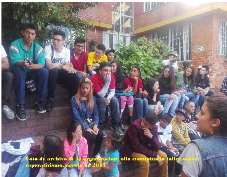
olla comunitaria taller sobre cooperativismo, agosto de 2017

El resultado del arduo trabajo en los campos se repartía entre el siervo y el señor feudal en el marco de una relación de dominación, puesto que, lo que obtenía el vasallo era