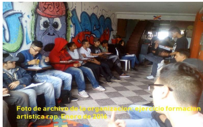
ejercicio formación artística rap. Enero de 2016

La convergencia de dichas necesidades permitió que 12 mujeres madres cabeza de familia confluieran en las mismas urgencias, dando lugar a dos grupos, con quienes se