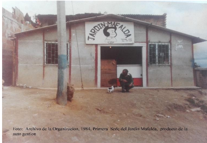
Foto: Archivo de la Organización, 1984. Primera Sede del Jardín Mafalda, producto de la auto gestión

La organización social de base sin ánimo de lucro “ Centro Infantil y Juvenil para el Desarrollo Comunitario ” CINJUDESCO - ASOVEG con Personería J. N° 703 del 12 de dic. Del Min. Justicia, Registro