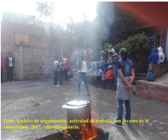
Foto: Archivo de organización, actividad de trabajo, con jóvenes de la comunidad, 2017, olla comunitaria.

contra unas largas dictaduras auspiciadas por los Estados Unidos y las empresas capitalistas multinacionales, mientras que en otros países como Colombia y Panamá el dominio de las élites económicas y políticas sobre el país no requirió la instalación de dictaduras para mantener el control sobre la economía y la sociedad en general (Serrano, 2010).