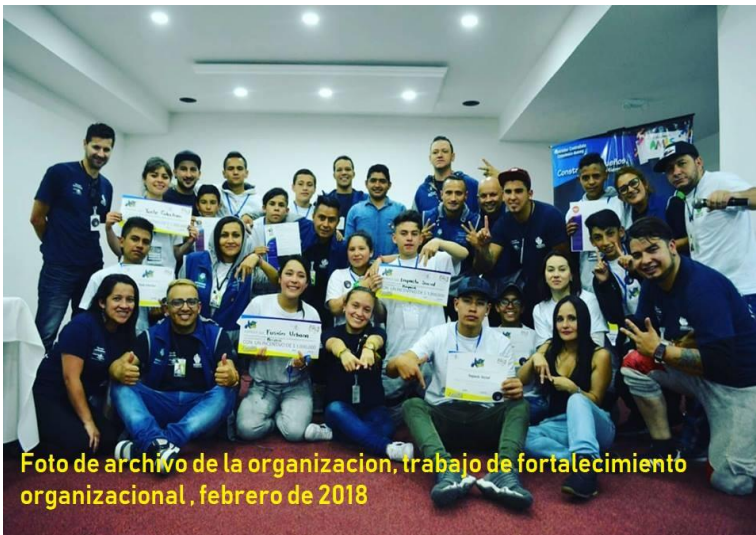
trabajo de fortalecimiento organizacional, febrero de 2018

Durante la década de los 80s del siglo XX en Colombia, el conflicto armado era agudo y se encontraba presente en la cotidianidad del país, las luchas armadas entre los grupos subversivos, el paramilitarismo y el Estado se hallaba en las zonas rurales del territorio nacional. Lugares en donde el Estado no hacía presencia. Territorios que eran ocupados por población campesinas, afrodescendientes e indígenas que vivía del pan coger, producto del cultivo de sus territorios, poblaciones rurales que habitaban en condiciones económicas de marginalidad. Parte de estas poblaciones sufrieron desplazamiento forzoso por causa de la guerra en sus territorios, situaciones que fueron el caldo de cultivo que aceleró el crecimiento de muchos sectores urbanos en grandes ciudades de Colombia durante las décadas de los 70s, 80s y 90s.