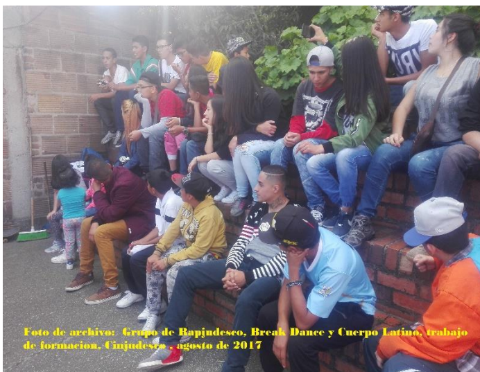
Foto de archivo: Grupo de Rapjudesco. Break Dance y Cuerpo Latino, trabajo de formación. Cinjudesco, agosto de 2017