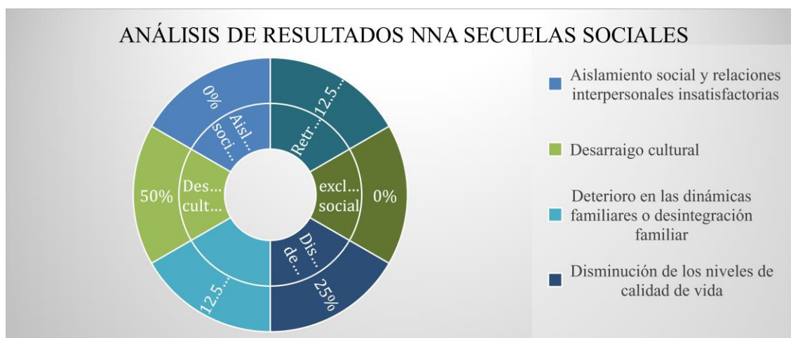
Gráfica No. 2. Análisis de resultados NNA, secuelas sociales