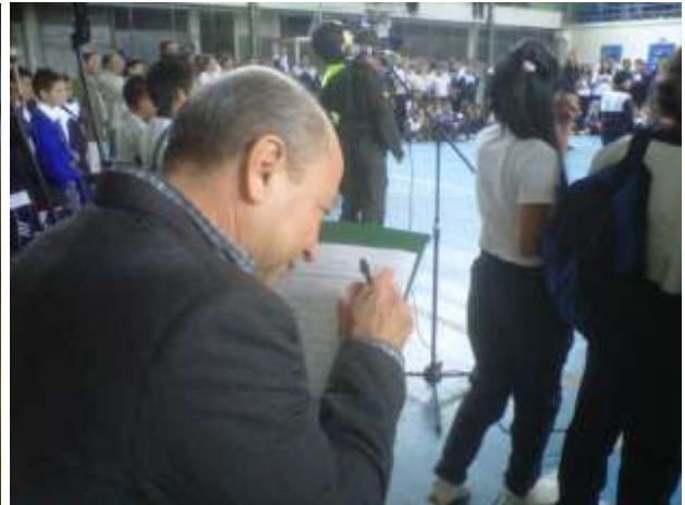
Entrevista y aplicación de prueba a docentes