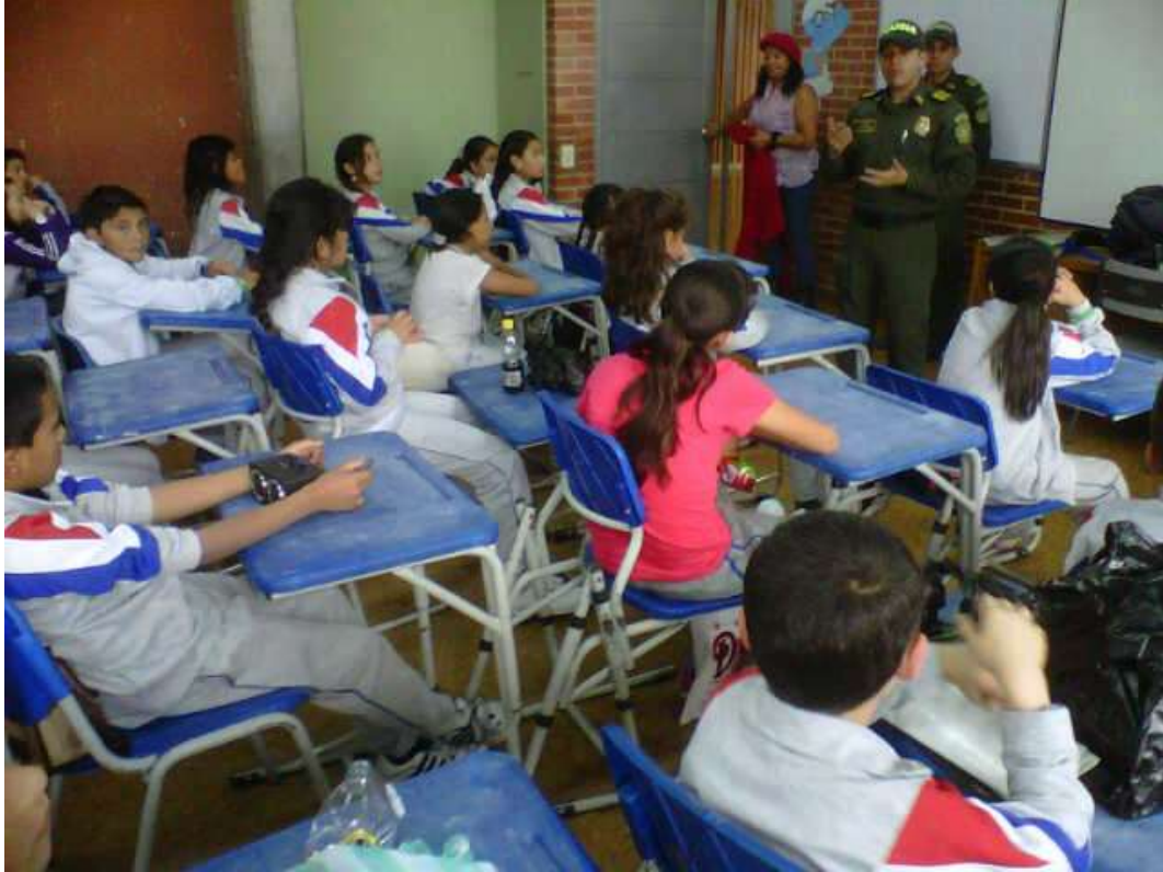
Explicación previa a la aplicación encuesta