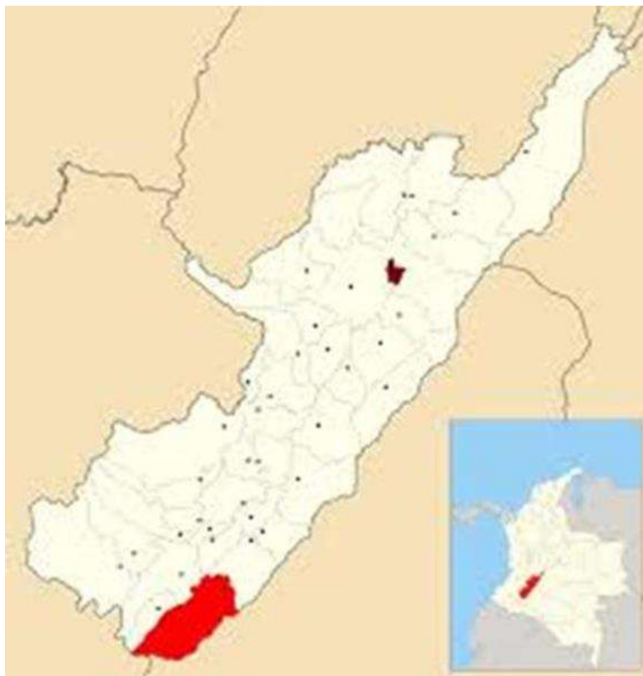
Grafico No. 1. Ubicación del Municipio de Acevedo en el departamento

El municipio de Acevedo se encuentra localizado al sur del departamento del Huila, se encuentra distante de la ciudad Bogotá, a 82 kilómetros, la altitud de la cabecera municipal es de 1348 msnm, limita al norte con el municipio de Suaza, al oriente con el municipio de Timaná, al occidente con el municipio de Palestina, Pitalito y al sur municipios de San José del Fragua - Caquetá y Piamonte – Cauca.