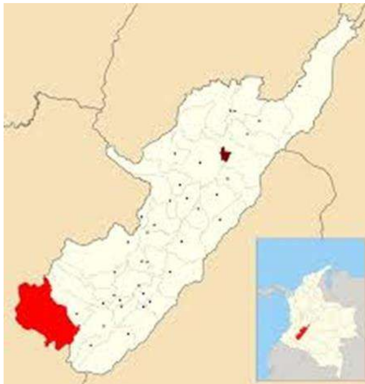
Grafico No. 3. Ubicación del Municipio de San Agustín en el departamento