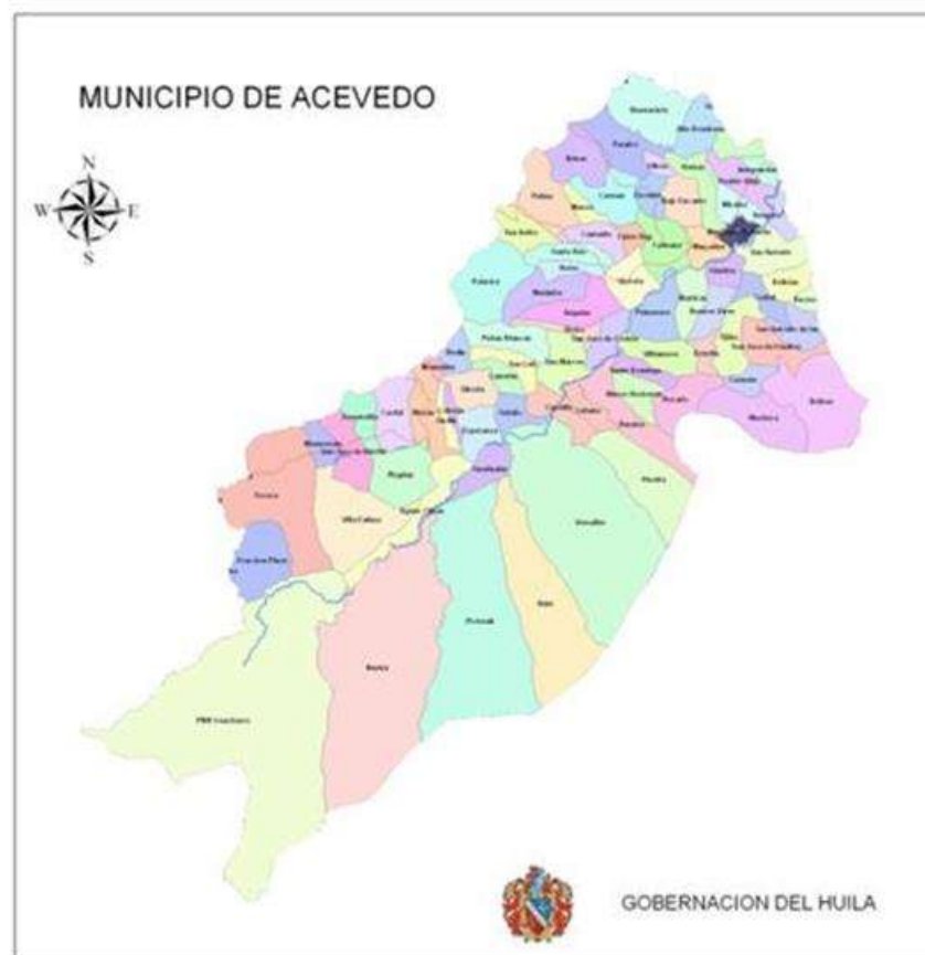
Grafico No. 5. Mapa división política del Municipio de Acevedo