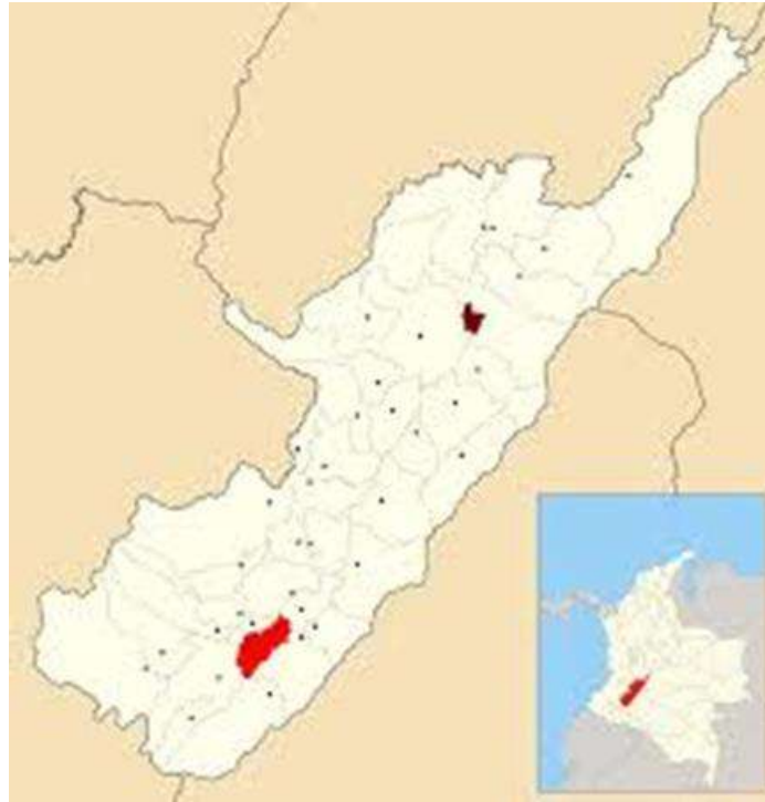
Grafico No. 2. Ubicación del Municipio de Timaná en el departamento