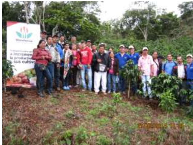
Autor: kerly Johana Antury

Fotografía No.4. Capacitación implementación sistemas de BPA, y fertilización vereda el salado Municipio de Acevedo