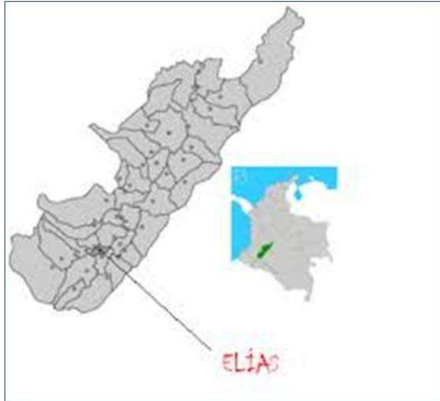
Grafico No.4. Ubicación del Municipio de Elías en el departamento