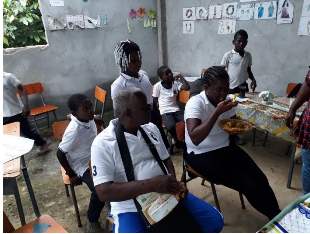
Figura 10: Comunidad educativa en muestra gastronómica