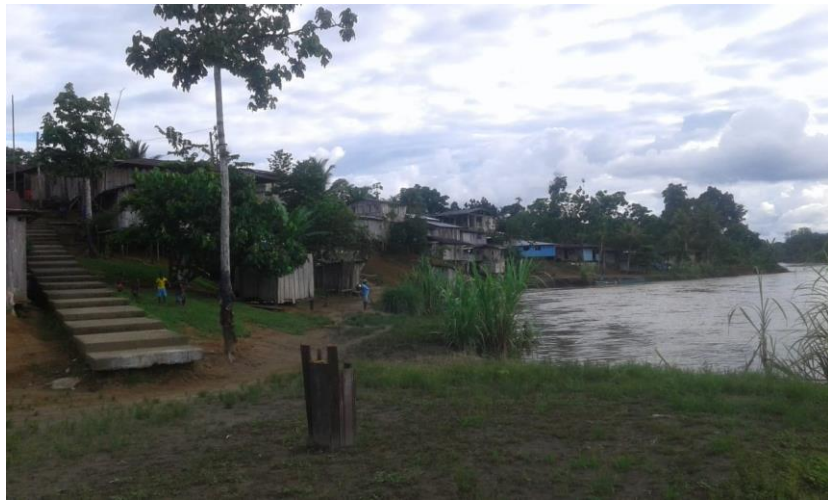
Figura 3: Vereda Brisas de Hamburgo.

Desde hace muchos años los abuelos tomaron este lugar por su ubicación geográfica, lo que representaba una riqueza debido a sus fuentes hídricas, fauna y la flora presente en el lugar, en aquella época la pesca, la caza y la agricultura eran las actividades más evidentes en este pueblo, realizaban mingas, e intercambiaban productos por trabajos, en donde el principal elemento era el fogón, que para los antepasados era lo más prioritario, hasta en las balsas, embarcaciones que los conducía a Satinga o Barbacoas las mujeres preparaban las comidas, realizaban el fogón encima de láminas u hoyas para que las embarcaciones no se quemaran.