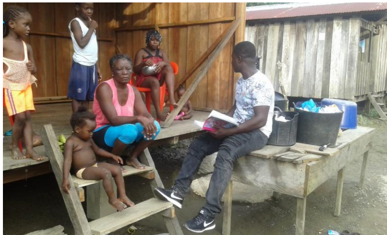
Figura 4: Dialogo con la comunidad

Cuentan muchos abuelos de que la alimentación de antes les permitía estar sanos y saludables y que la intención de ellos es dejarles esto como herencia a los jóvenes de hoy, para que esto quede sembrado en la memoria histórica de la comunidad y las futuras generaciones.