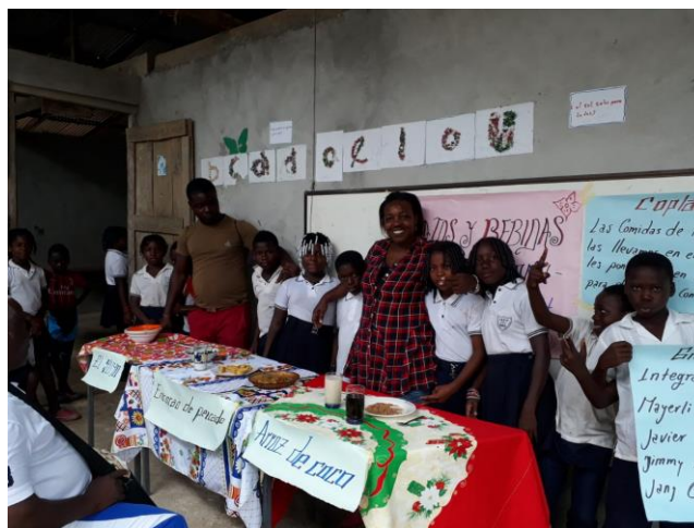
Figura 9: Docentes y estudiantes en muestra gastronómica