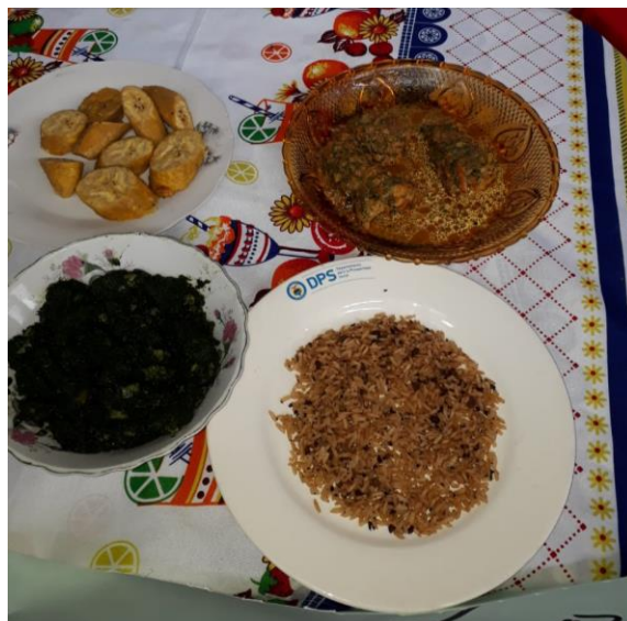
Figura 8: Platos típicos de la región