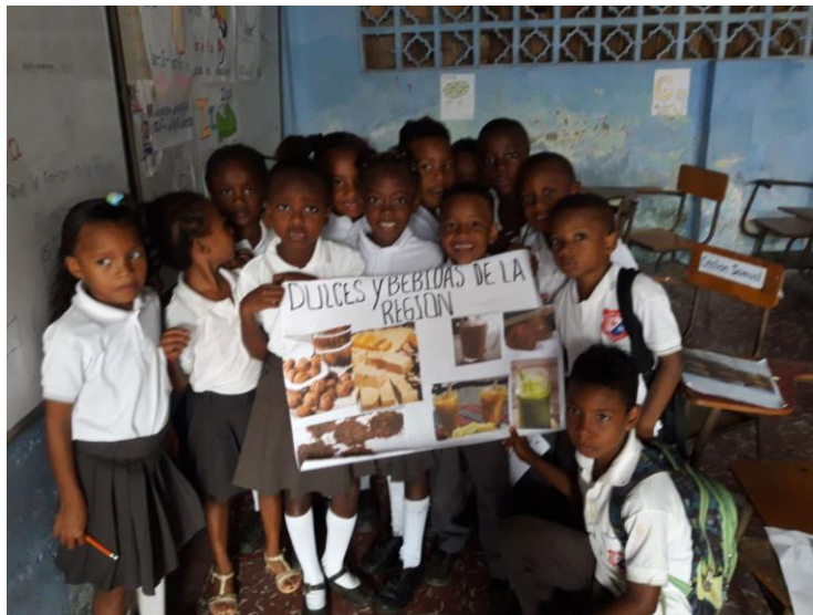
Figura 5: Estudiantes en muestra gastronómica

En cumplimiento del tercer objetivo específico se realizó una muestra gastronómica en compañía de los estudiantes del Centro Educativo Brisas de Hamburgo, Municipio de Magui Payan, junto con la comunidad de Brisas de Hamburgo, como resultado de ello, se obtuvo los siguientes registros fotográficos.