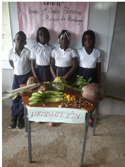
Figura 6: Estudiantes en muestra gastronómica