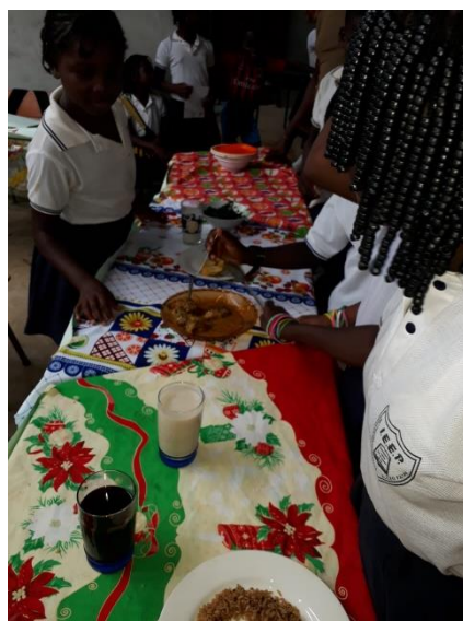
Figura 7: Estudiantes en muestra gastronómica