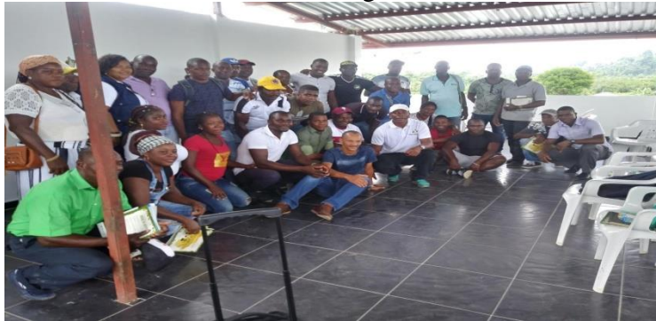
Figura 3: Grupo de trabajo “Consejo Comunitario”