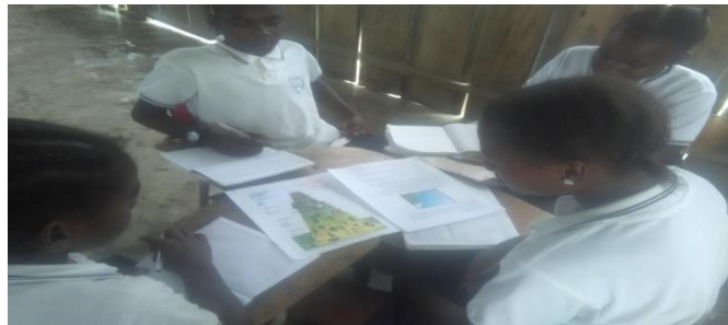
Figura 8. Socialización Biodiversidad

Este tema fue importante porque los estudiantes se dieron cuenta porque Colombia esta denominado como el segundo país con mayor Biodiversidad del mundo, se evaluó a los estudiantes por medio de preguntas directas, se pudo evidenciar que los estudiantes aprendieran de Biodiversidad, fue importante el tema para los estudiantes del grado quinto de primaria, que se motivaron para una salida de campo, el tema fue muy importante para los futuros etnoeducadores que les va a permitir aplicar la enseñanza aprendizaje haciendo es decir utilizando herramientas pedagógicas de la región.