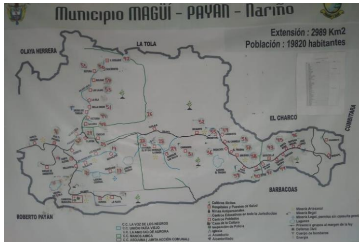
Figura 1 División Política de Magüi, Payan