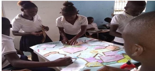
Figura 5. Grupo de trabajo”División política de Colombia”