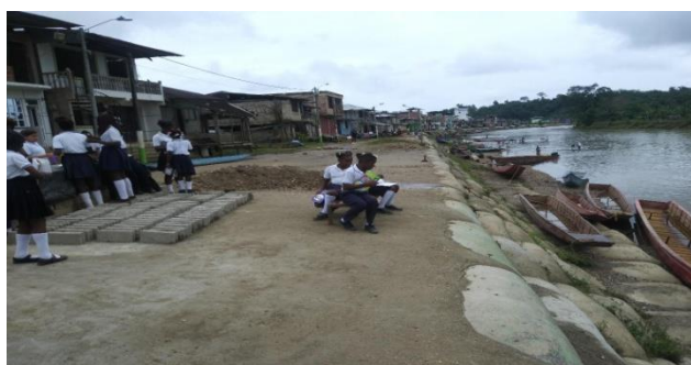
Figura 14: Socialización “Consejo Comunitario”

sobre todo por las realidades del mundo actual y las características de las sociedades modernas, donde el número de hombre y mujeres, con un alto nivel educacional y cultural es cada vez más amplio, se hicieron anotación en el cuaderno, luego se dejó trabajos individuales para la casa, después se los evaluó del tema tratado, teniendo como resultado, los estudiantes del grado quinto con conocimiento en forma organizativa de trabajo, que les permitirá una vez terminen sus estudios, tener la posibilidad de organizarse y pensar en formar empresas productivas o de servicio, para alcanzar un buen vivir en la vida cotidiana que les espera el futuro, para los docentes etnoeducadores tienen aquí la posibilidad de impartir sus conocimiento de enseñanza aprendizaje, para impulsar nuevos orientadores para el campo productivo empresarial.