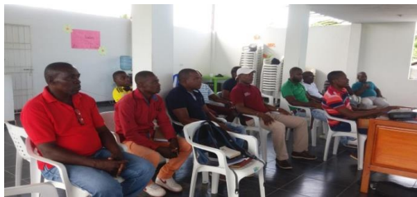
Figura 12. Reunión Grupo Consejo Comunitario.