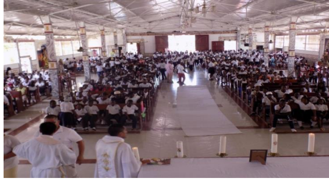
Figura 16. Eucaristía comunitaria”