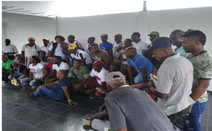
Figura 2: Socialización “Consejo Comunitario”

permite al estudiante conocer su territorio relacionarse con los mayores y comprender que al pesar de estar en un mismo territorio se tiene diferentes dialectos, prácticas y costumbres, que se evidencian de una vereda a otra, el cual se debe respetar, aceptar y compartir sin discriminación y como profesional aporta a que se debe enseñar a los estudiantes, primero el territorio donde habita, tener la capacidad de pensar y dar soluciones a los diferentes problemas que se presentan en el aula de clase.