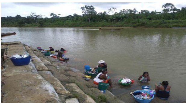
Figura 11: Socialización Escenarios”