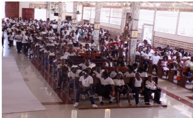
Figura 17: Eucaristía “Escenario de aprendizaje”