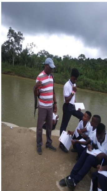
Figura 10. Socialización “Escenarios de Aprendizaje”