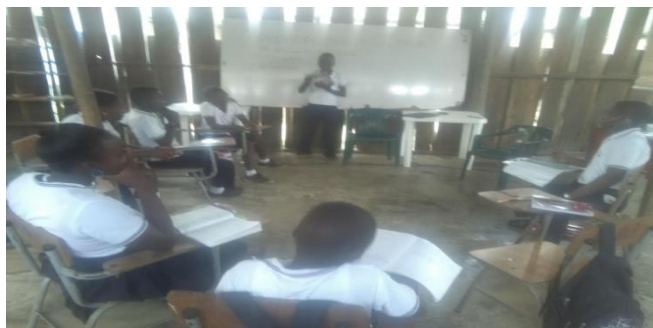
Figura 18: Socialización actividad

El territorio Colombiano está dividido en áreas pequeñas que facilitan conocer y entender las necesidades de la población, distribuir los recursos y organizar el gobierno, estos territorios reciben el nombre de entidades territoriales, las entidades territoriales de Colombia son: Los Departamentos Municipios, los distrito y los territorios indígenas, Colombia tiene 32 departamentos y cada departamento está conformado por Municipio y tiene una ciudad capital, por lo general la ciudad capital es la más poblada del departamento. Anotación en los cuadernos, realización de trabajos individuales en clase, exposiciones de los trabajos anteriores, evaluación de las actividades anteriores, se revisaron los cuadernos y se calificó con la participación en clase, estas actividades fueron muy buenas para los estudiantes porque les permitió conocer y entender los entes territoriales de Colombia, para los docentes etnoeducadores fue de vital importancia orientar ese tema, que les permitió a los estudiantes despejar sus dudas y motivarlos para lograr los objetivos propuesto.