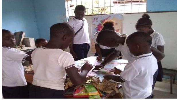
Figura 4: Actividad “División política de Colombia”