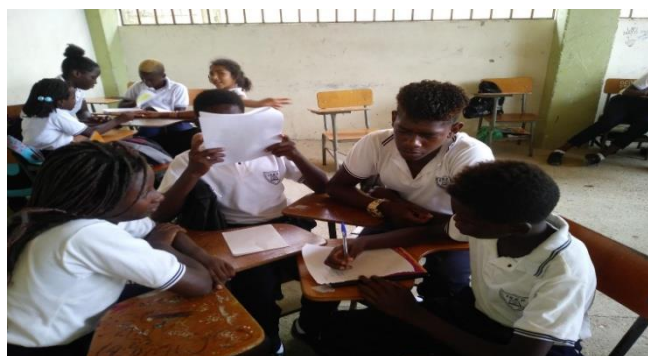
Figura 15: Actividad grupal