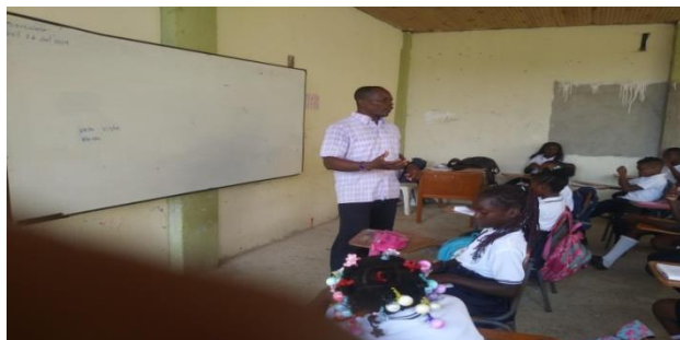
Figura 19. Dialogo “Sistema económico de Colombia”