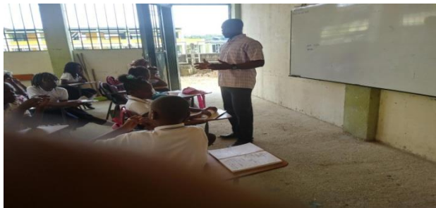
Figura 19: Socialización “Sistema económico en Colombia”

Se hicieron anotación en el cuaderno, luego se propuso trabajar en grupos de cuatro estudiantes, para poder evidenciar como un sistema propone cambios o modificaciones a la norma, que su decisión afecta al resto de la comunidad, luego se hicieron las evaluaciones orales, como también de los resumen de plenaria de los grupos, se hizo la evaluación y se pudo evidenciar que los estudiantes entendieron el tema en mención, porque respondieron acorde a lo preguntado, los estudiantes les gusto el tema tratado, los docentes etnoeducadores de la institución educativa deben interesarse por orientar a los estudiante con ética y valores y el respeto por la naturaleza, ya que el tema visto queda evidenciado que el sistema capitalista sólo le interesa los recursos naturales, e imponer su dominio desde el poder económico y político.