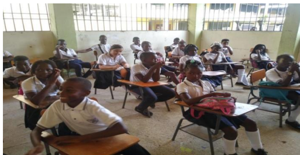
Figura 13. Alumnos 5°