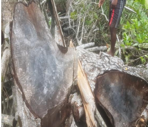
Figura 11: corte de manglar por parte del humano

un fuerte desequilibrio en la vida de estas especies, las cuales deben salir a buscar otros lugares.