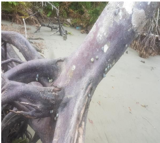
Figura 2: manglar en su estado natural con los piacuiles

La importancia del ecosistema manglar es que protege a gran cantidad de los organismos que alberga, los protege en sus troncos, entre sus raíces o en la parte alta de sus ramas, tales como bacterias y hongos, que intervienen en la descomposición de materiales orgánicos e incluso transforman materiales tóxicos como el azufre o sulfuro, purificando el agua que llega al mar. Por tanto, debido al deterioro del manglar está perdiendo su capacidad de transformar los materiales tóxicos y purificar el agua; lo cual trae un fuerte impacto en la comunidad que ya no los pueden utilizar de manera para complemento en su alimentación de manera natural ni para apoyo de sostenimiento familiar en la parte económica y cultural.