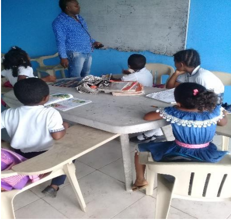
Figura 6: los alumnos observando sobre la temática de los peces que viven en manglar