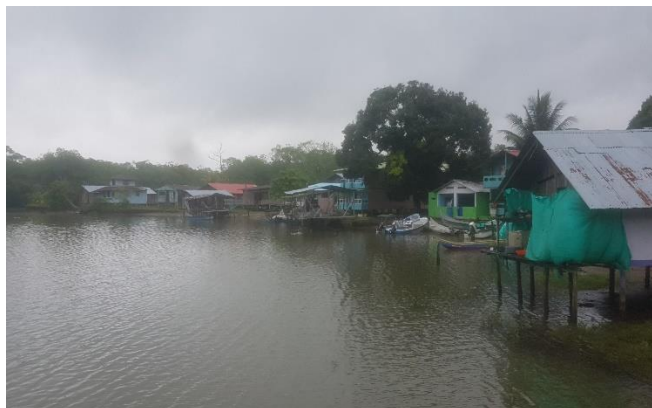
Figura 1: asentamiento humado comunidad de Trejos del Mar

Bien es cierto que en el municipio Mosquera Nariño desde hace muchos años atrás las personas se han beneficiado de los recursos del manglar de forma sana, en el pueblo lo utilizan como elemento base para la construcción de sus viviendas es decir para puntales 1 , colgaduras 2 , columnas 3 y azoteas 4 etc.; cómo también para la leña en el uso de la preparación de alimentos, pero desde hace algún tiempo sea venido observando que las personas ya no lo utilizan solamente para los fines antes mencionados sino también para otras cosas particulares que desde luego se salen de los patrones culturales de esta comunidad; como por ejemplo, la venta y comercialización de este producto trae consigo la pérdida de valores culturales, inseguridad en la zona pues es una isla y son precisamente los que nos protegen de las fuertes corrientes marinas.