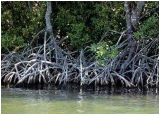
Figura: el manglar en sus partes baja