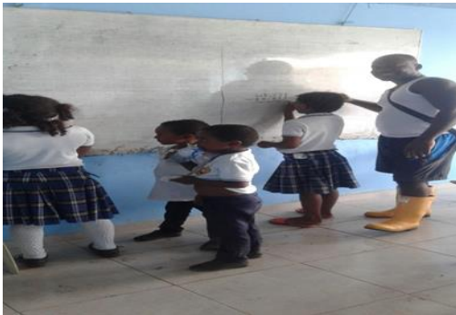
Figura 12: aula donde se dicta las clases pedagógicas.

Los estudiantes de la comunidad de Trejos con actividades de dibujos sobre lo que les rodea se muestran muy contentos y preguntan para saber cómo pueden cuidar los peces para que no se mueran.