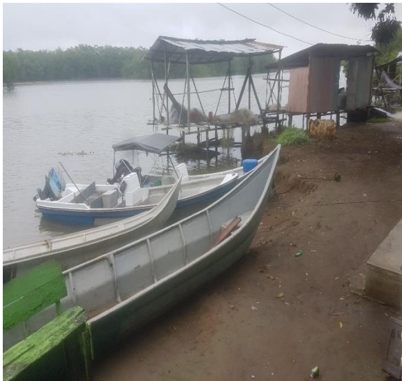
Figura: fotografía de canoas con motores fuera de borda y asentamiento humano