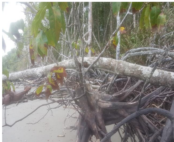
Figura 5: tala indiscriminada de manglar