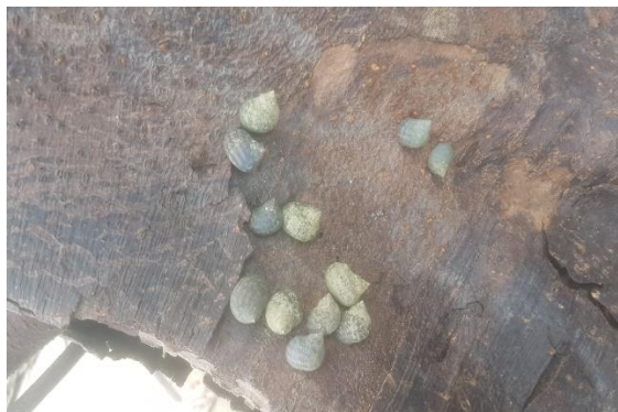
Figura 4: piacuales ubicados en un tronco de mangle.

La Piángua 6 , el pescado 7 , el Piacuíl 8 , el tasquero 9 etc. Que se encuentran en las partes bajas raíces como también el perico, la iguana, oso hormiguero las aves que se encuentra en las partes altas ramas. Por lo mismo a los niños hay que enseñarles de manera creativa y participativa a amar la naturaleza saber cómo y cuándo hay que cortar árboles y donde sembrar.