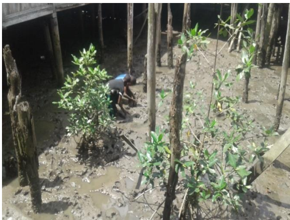
Figura 10: alumnos sembrando semillas del manglar.

Mediante las actividades realizadas, donde la comunidad estuvo involucrada, ayudándole a los estudiantes a comprender lo explicado y puesto en práctica en este proyecto. Se puede afirmar que todas las actividades realizadas se hicieron con una gran aceptación por los estudiantes y algunos padres de familia.