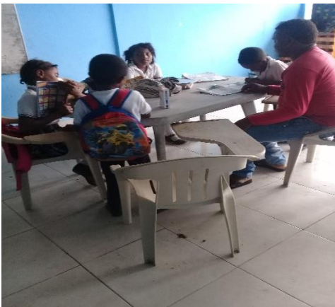
Figura 7: imagen de socialización de la temática sobre la salida a campo