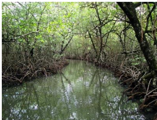
Figura 3: manglar llamados esteros.

Asociados a los manglares viven una gran variedad de vegetales, cientos de hongos, y decenas de especies de plantas acuáticas, que son la base productiva del ecosistema. Cuando sus hojas caen alimentan a una enorme diversidad de organismos y también a los ecosistemas vecinos, puesto que exportan parte de esa energía. Es así como favorecen la reproducción de innumerables especies marinas, que desembocan en los esteros 5 y en algunos casos pasan algún periodo de su desarrollo en el ecosistema en busca de alimento y protección de las especies marinas dependen del ecosistema de manglar para subsistir, por lo que la destrucción del mismo incide en la disminución que se concentran en los manglares como son: