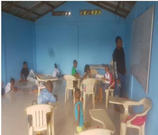
Figura 9: estudiantes en el aula educativa.

Esta propuesta de manera metodológica se fundamenta en el aprendizaje creativo y participativo que busca la forma, donde el niño por medio de conocimientos sienta amor por lo propio y la naturaleza, formándose para cuidarlo y protegerlo de manera creativa; con bailes, cuentos, carteleras y organizaciones de salidas al campo, siendo ellos los interesados de manera creativa en la clase, donde el docente es el orientador y que no lo miren siempre como la persona que solo le puede aportar escritura y dictados por lo contrario brindarles conocimientos de una manera real , con dinámica y divertidas aventuras donde todos aprenden.