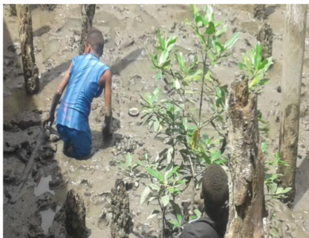
Figura 8: estudiantes en el lugar de la siembra de las semillas del manglar.

La educación para el territorio de Mosquera debe tener más espacios que inciten al niño a interesarse por conocer y manejar lo que en el presente y futuro será su gran apoyo en la mayoría de los aspectos económicos, sociales y culturales. Más que una teoría de cómo, cuándo y que se puede hacer respecto al medio ambiente que los rodeas deben recibir y tener prácticas que los sensibilice para que vean el ecosistema manglar como el regalo preciados que les proporciona la naturaleza y que si ellos ayudan a mejorar podrían vivir de manera diferente ya que siempre se tiene la idea que para poder vivir de una manera digna deben ir se de sus lugares de residencias o comunidades a la que ellos mismo lo llaman “ la civilización” o ciudades adquirir conocimiento sobre otros temas relacionados con tecnología, urbanidad entre otros lo cual no es malo pero apenarse de lo propio solo lleva a las futuras generaciones a un desconocimiento total de las riquezas de su entorno y no ver estos recursos como una fuente de vida digna y sana con mucha enseñanza para el resto del país y por qué no al mundo. Figura: estudiantes en el lugar de la siembra de las semillas del manglar.