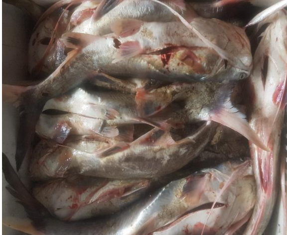
Figura: fotografía de peces alguaciles