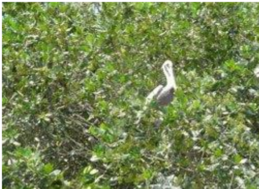
Figura: ave en la parte alta del manglar