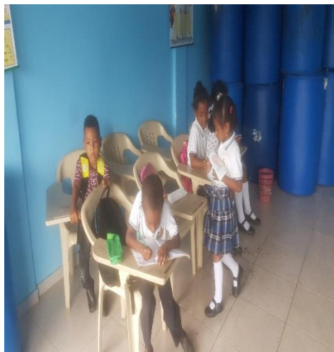
Figura 14: alumnos recibiendo el tema sobre el manglar

Los estudiantes son muy conscientes que el ecosistema que quieren conservar es muy codiciado por que de este depende la economía familiar y el sustento de muchas familias; por dicha razón es que se trabajó en la manera de como impedir que haya mala práctica en cuanto al uso de este recurso y permitirle a los niños trabajar juntos por el bienestar y la naturaleza y el futuro que a ellos los espera, y es por eso que nuestro modelo pedagógico el cual nos permite ser orientadores y guías de los estudiantes en su proceso de aprendizaje es por eso que a ellos, los hemos estado motivando a que aprendan más del mangle y así sean muy útiles para el avance de esta iniciativa de conservación de este recurso permitiéndose que se expresen con claridad sus ideas que ayuden al bienestar de esta especie que es tan importante en nuestra costa pacífica Colombiana.