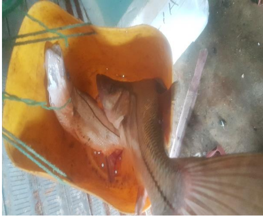
Figura: peces machetazos