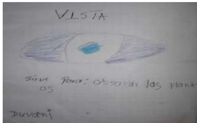
Figura.12. Dibujo de estudiantes, los sentidos

Para la temática de los sentidos. Dibujar el sentido que más allá llamado su atención y describir para que le sirve.