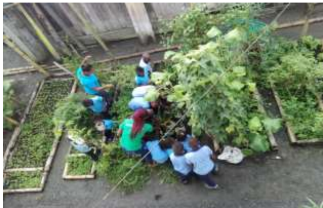
Figura 6. Salida de campo con los estudiantes

Durante la realización del recorrido en las huertas caseras de plantas medicinales, algunos estudiantes reaccionaron un poco sorprendidos por la variedad de plantas que había otros estuvieron atentos a la explicación dada por la sabedora de igual manera estuvieron atentos al desarrollo de la temática al regresar al aula de clase se evidenció que los estudiantes en su mayoría sí le prestaron atención y mucho interés al recorrido educativo donde se les preguntó los nombres de las diferentes plantas que habían conocido en una hoja de block cada estudiante dibujó la planta que más le llamó la atención. De igual manera los estudiantes en grupo de tres personas identificaron 3 plantas medicinales con sus respectivos nombres y las pegaron en una hoja de block.