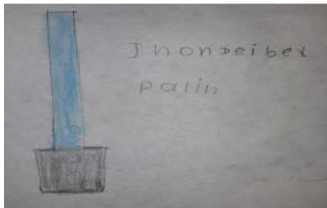
Figura 14. Dibujo de estudiantes, materiales de construcción

Para la temática de los materiales de construcción de la granja pedagógica: observar detenidamente los materiales de construcción que esta ubicados al frente, escoger uno y dibujarlo.