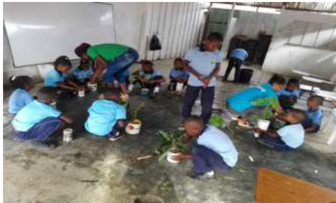
Figura 11. siembras de plantas medicinales

Para el desarrollo de las actividades de siembra de las semillas y plantas medicinales se utilizaron los tarros, canecas, bandejas, baldes, botes y tanques plásticos obtenidos a través del reciclaje. A cada niño se le entregó el tarro que había adecuado y decorado también se les dio la oportunidad para que ellos mismos eligieran la planta de su gusto para sembrarla, con la supervisión de las docente en formación y algunos mayores de la comunidad cada estudiante fue desarrollando la actividad de siembra, paso a paso: