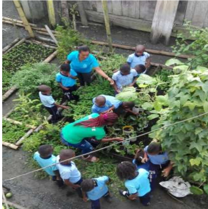
Figura. 17 Estudiantes en la granja pedagógica