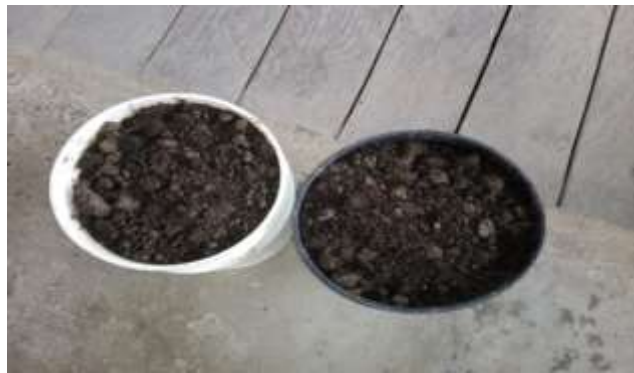
Figura 10. Tierra acta para la siembra de plantas medicinales

tres tiempos es decir sembramos la planta en tres recipientes con los tres tipos de tierra, una con tierra reseca, otra con tierra muy humedad y la última con tierra fértil obtenida de las granjas caseras de la comunidad y como resultado después de tres días obtuvimos, una planta podrida por la húmeda, otra reseca por la resequedad de la tierra empleada y la última , planta estaba vigorosa, muy hermosa, brillante y además había crecido un poco y así de esta manera los estudiante comprendieron la importancia de seleccionar un buen terreno para la siembra de las plantas medicinales.