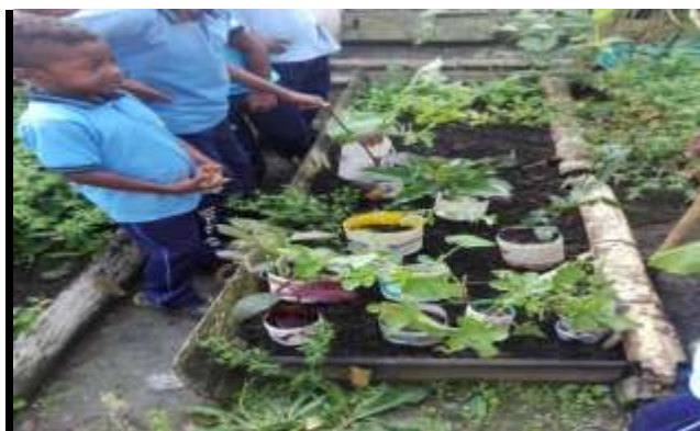
Figura 15. Siembra de plantas medicinales

Para la actividad de siembra de las plantas medicinales de la región: cada niño escogió su planta medicinal a través de las observaciones realizadas durante el recorrido en la comunidad de pumbi las lajas para luego sembrarlas.