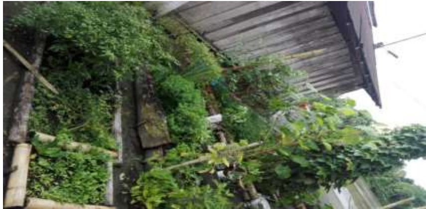
Figura 1. Granja pedagógica de la vereda Pumbi las Lajas