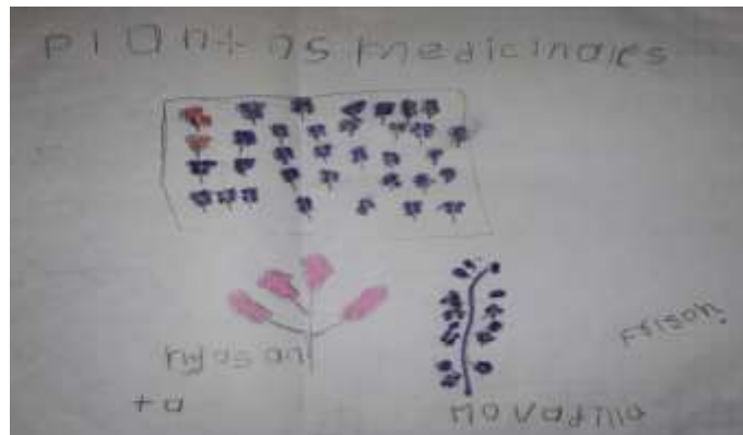
Figura 13. Dibujo de estudiantes, plantas medicinales

Para la temática de las plantas medicinales: dibujar la planta medicinal que observo y llamo su atención durante la actividad de salida de salida de campo.