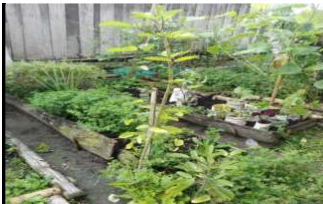
Figura 16. Plantas medicinales