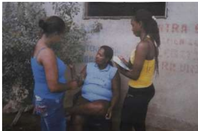
Figura 3. Entrevista a sabedora y conocedora de la medicina tradicional

medicinales donde a hora cultiva variedad de plantas que utiliza para sanar y curar las diferentes enfermedades que se han presentado tales como: dolor de barriga, dolor de cabeza, malaire, anemia, mal de ojo, mordeduras de culebras, el pasmo, inflamación, bichos o cangrina, salpullidos, bonitos, vaso con hígado, el asma, el dolor de oído, baldadura, papera, la gripa, a las personas que lo necesiten en su relato nos mencionó algunas de las plantas que cultiva en su granja como son: el paico, la verbena, la hoja santa, la malva, el discancel, el chocolate, el gallinazo, la santa maría de colino, zapote, yanten, chivo, mata ratón, flor amarilla, moradilla, menta, yerba de mora, hoja de mano. Bledo, verdolaga, ortiga, guadua, espinaca. hoja de achote, pronto alivio, toronjil, ajengibre, orégano, zapata, mapan, anamú, yerba de perro, churco platanero, yerba buena, Artemisa, ruda, invian, la doncella, golondrina siempre viva, hoja de aguacate, botoncillo, suelda con suelda y lana de balsa.