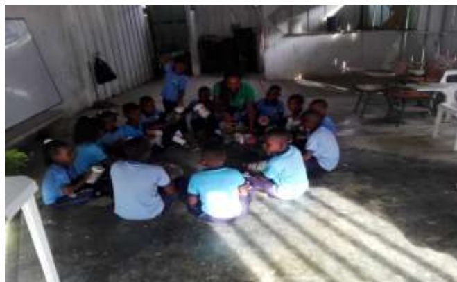
Figura 8. Recolección de objetos no convencionales

El recorrido se organizó de manera colectiva con los grupos de trabajo ya formados en el aula de clases donde a cada grupo se le designo reciclar o recolectar un material distinto para la selección y siembra de la semilla y plantas medicinales, donde los materiales a reciclaje fueron los no convencionales como son: baldes, bandejas, canecas, pomas, galones, botes, tarros tanques y vasos plásticos. el recorrido se realizó en el lazo de tiempo de 30 minutos es decir media hora donde los niños fueron recogiendo los materiales que hallaban tirados en el suelo, luego de esto nos dirigimos al rio para lavar y limpiar los materiales reciclado, después de estar limpios se colocaron al sol para que secan y proceder a su elaboración y decoración con pinturas, temperas y vinilos con el fin de acondicionarlos para lo requerido