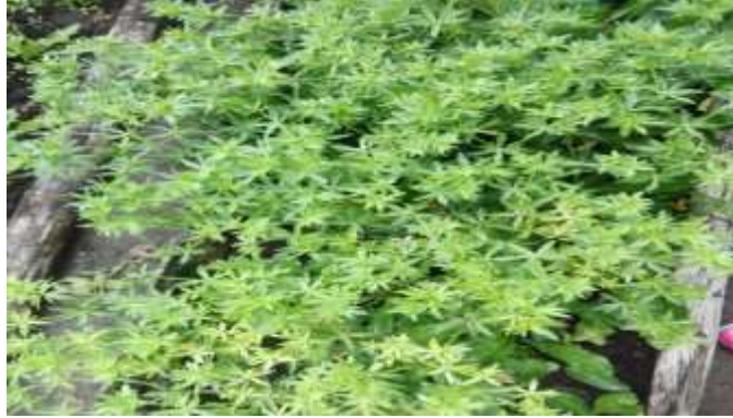
Figura 9. Semillas de Planta medicinal

Selección: luego de obtener las semillas las seleccionamos según la temperatura ambiente que requiere cada una de ellas para llevar cabo una reproducción y estabilidad exitosa, teniendo en cuenta la humedad y el sol debido a que si no se mantiene estabilizada la temperatura obtendrán entrada los factores de riesgos como son las plagas que actúan rápidamente ante el descuido humano por la naturaleza.