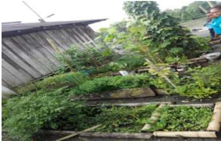
Figura 4. Plantas medicinales