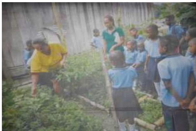
Figura 5. Explicación de sabedora del conocimiento de las plantas medicinales

se utilizan donde tuvo desarrollo el tema de los sentidos debido a que los niños observaron, tocaron, percibieron y escucharon todo acerca del conocimiento de las plantas medicinales de su entorno.