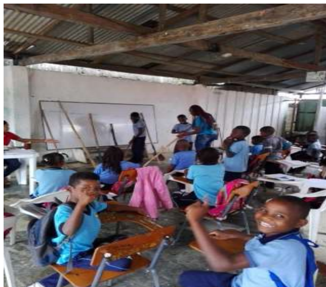
Figura 7. Materiales para la construcción de granja pedagógica