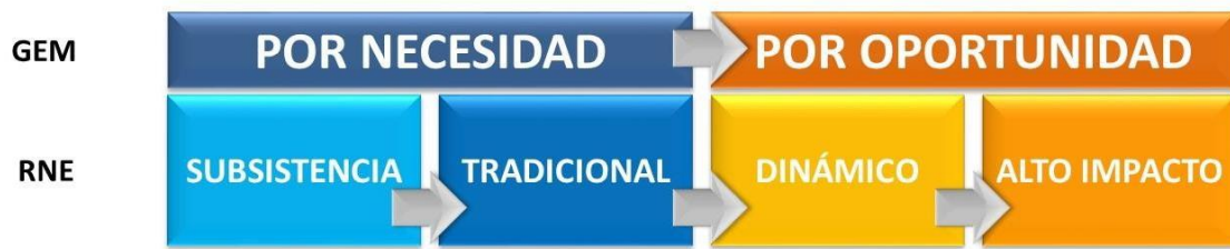
Ilustración 2 Tipos de emprendimiento