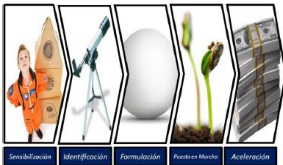
Ilustración 1 - Cadena de valor del emprendimiento