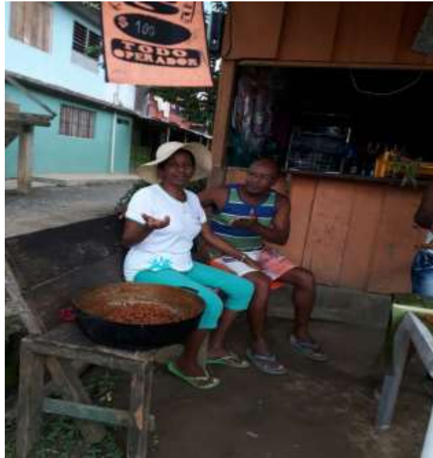
Figura 9: Mentidero en una casa

comunidades Afronariñenses. Las investigadoras pudieron darse cuenta que los estudiantes y el ser humano afro aprenden más rápido con la práctica que con la teoría.