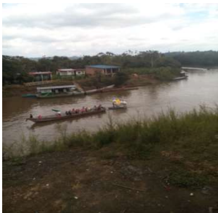
Figura 8: Representación Fluvial del Pueblo

institución educativa, haber desarrollado el plan de aula 1, que sirvió para retroalimentar y mejorar las dificultades que tuvieron algunos estudiantes en el DBA1, realizar la convivencia con los estudiantes y sabedores, con la realización del paseo a la playa, haber integrado a sabedores al proceso educativo y en la convivencia, haber dejado un mentidero en la playa para que otros cuando vayan también lo utilicen, que los estudiantes hayan comprendido la importancia del mentidero y que lo reconozcan como escenario de aprendizaje colectivo de las comunidades Afromariñenses.