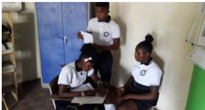
Figura 10: Estudiantes en trabajo colaborativo