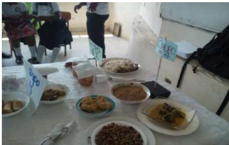
Figura 6: Feria Gastronómica IE San José del Telembí