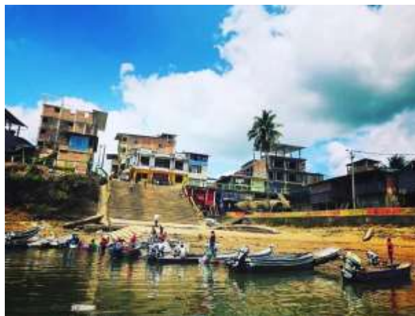
Figura 2: Paso Grande Roberto Payan

El municipio de Roberto Payan para el año 2016 tiene una de población de 23.287, de las cuales el 94,57% pertenecen a la zona urbana, esta postura tiende a mantenerse puesto que el crecimiento poblacional de los cuatrienios no supera los dos puntos porcentuales según las proyecciones. (p.35)