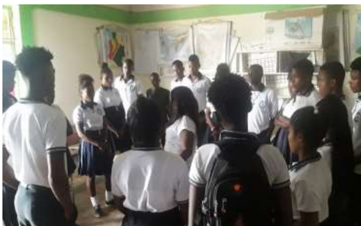
Figura 3: Grupo De Estudiantes del Grado 8 de la IETA San Jose del Telembi

el Pacífico y su Tragedia, de Luz Adela Biojo Estacio, contribuir y participar en la construcción de un canto afro y reconocer el Chigualo como ritual de las comunidades afronariñenses. Las investigadoras enseñaron estos saberes utilizando recursos como: libros de investigación, fotocopias, computador, videobim, revistas, videos, borradores, tablero, marcadores, cartulina y el equipo humano (sabedores (as), estudiantes, investigadoras).