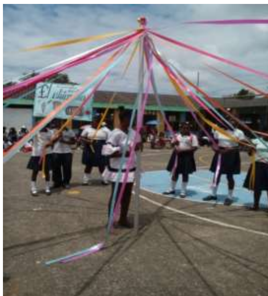
Figura 5: Estudiantes en dramatización de la danza Chigualo.

propuesto, se acoplaron los saberes a la propuesta de investigación, pocos estudiantes comprendieron y captaron el tema del Chigualo, planificaron las clases, desarrollaron el diario de campo, los formatos, sacar evidencias y entregar a tiempo sus trabajos realizados.