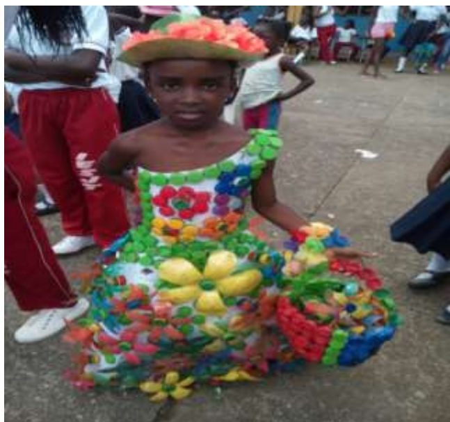
Figura 7: Representación Cultural del reciclaje.