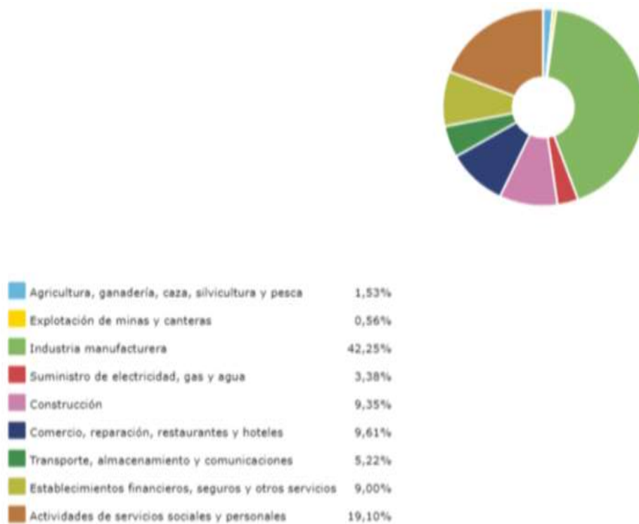
Figura 2. Reglones de la economía en Mosquera. (DANE, 2018).

En el sector comercio y servicios se encuentra una gran variedad de establecimientos comerciales como salones de belleza, depósitos, droguerías, ferreterías, supermercados, papelerías, restaurantes, entre otros, servicios públicos, corporaciones y bancos. Es de destacar que el comercio del municipio no se encuentra organizado, dependiendo en su mayoría de suministros de la capital. En cuanto al sector educativo cuenta con más de cuarenta y dos establecimientos educativos entre privados y públicos. El sector de la construcción ha permitido ofrecer empleo a los habitantes del municipio, debido a la construcción de urbanizaciones (Departamento Nacional de Estadística, 2015).