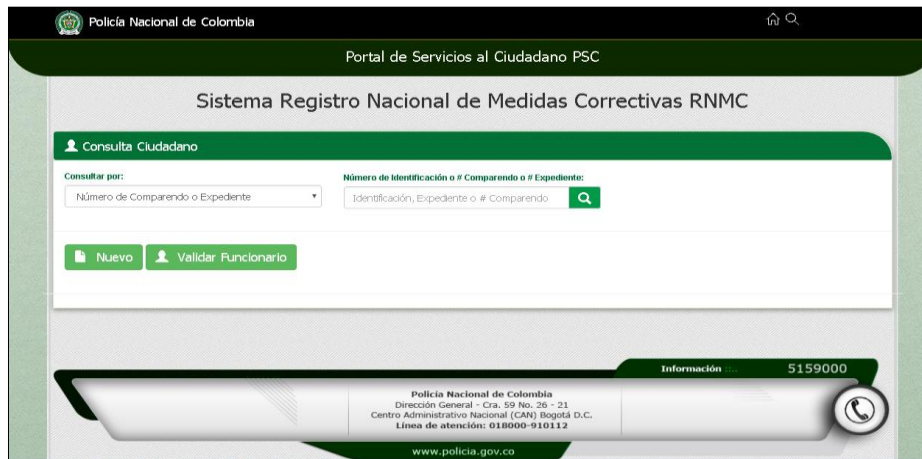
Portal del Registro Nacional de Medidas Correctivas (RNMC)

La información para el desarrollo del presente trabajo, se recopila con la observación de los resultados del Modelo Nacional de Vigilancia Comunitaria por Cuadrantes aplicado en el municipio de Barrancabermeja.