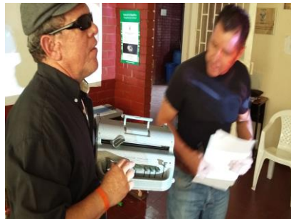
Figura N5. Máquina Perkins