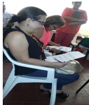
Figura N. 4 Explorando material pedagógico

Conectando sentidos es un proyecto que consiste en mejorar, asesorar y acompañar los procesos de inclusión de estudiantes y personas de la comunidad con limitación visual (Ciegos, Sordo ciegos y Baja Visión) a través de ayudas técnicas gestionadas en convenio con la escuela normal Superior de Ibagué, la asociación Colombiana de sordo ciegos SURCOE, el ministerio de tecnologías de la información y las comunicaciones y, la Alcaldía de Ibagué.