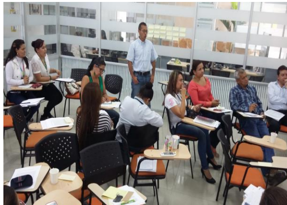
Figura 2. Funcionarios del SENA

Asistentes: Funcionarios de la Regional Tolima de las áreas: Relacionamento Corporativo, APE, Apoyo Administrativo, Apoyo a la formación, Coordinadores académicos y misionales, Instructores designados por cada centro de formación, Secretaria de salud Dpto., Fundación Unámonos, PcD Egresados Sena, Intérpretes de Lengua de señas, Coordinador de Sala Conectando Sentidos ENSI.