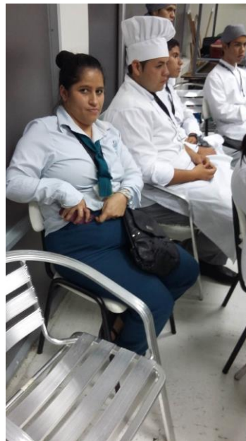
Figura N 8 Aprendiz con discapacidad física