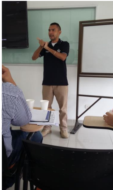
Figura N. 6