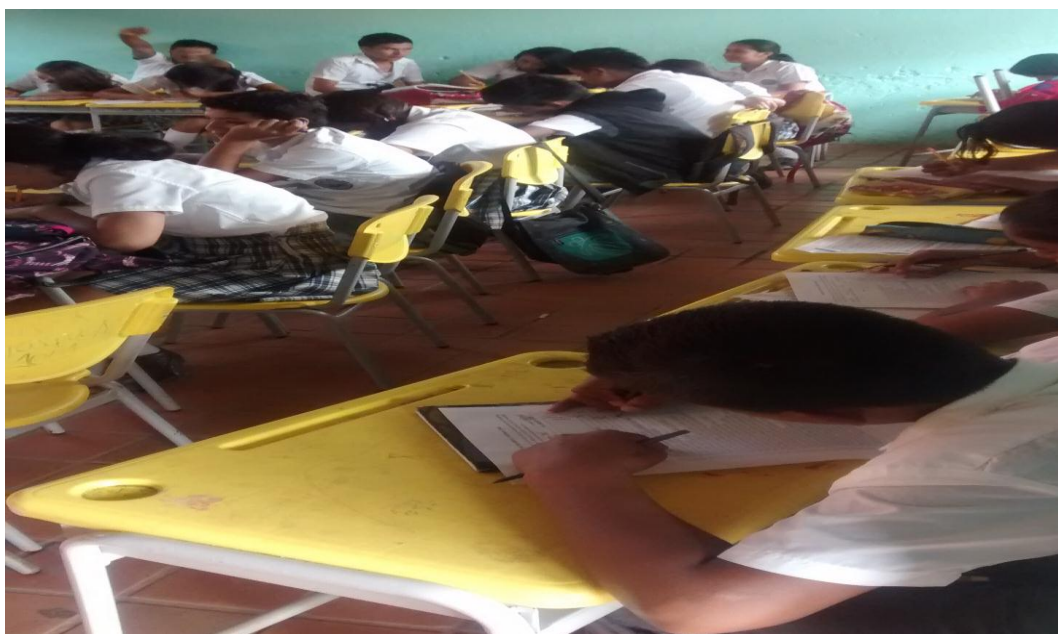
Anexo 14. Taller y aplicación de cuestionario sobre competencias ciudadanas dirigido a los alumnos del grado 8 de la Institución Educativa CDR