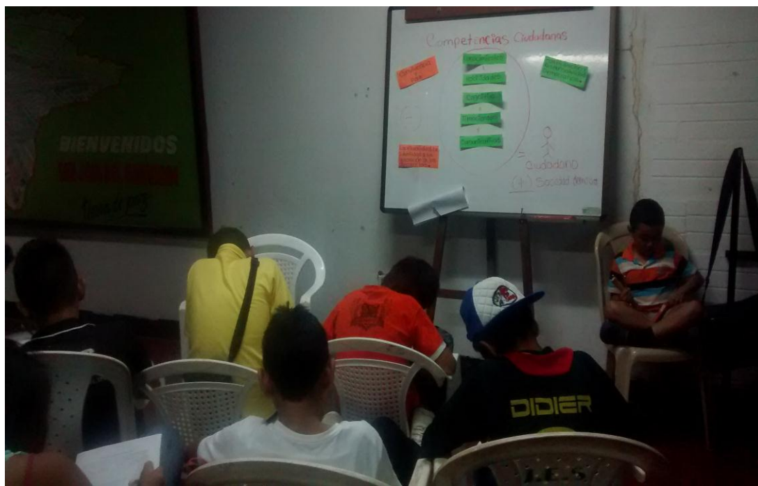
Anexo 12. Taller y aplicación de cuestionario sobre competencias ciudadanas dirigido a los alumnos del grado 8 de la Institución Educativa Santander