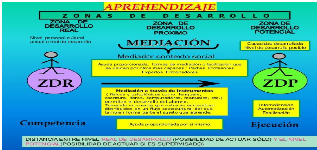
Imagen 1. Teoría sociocultural de L. Vigotski