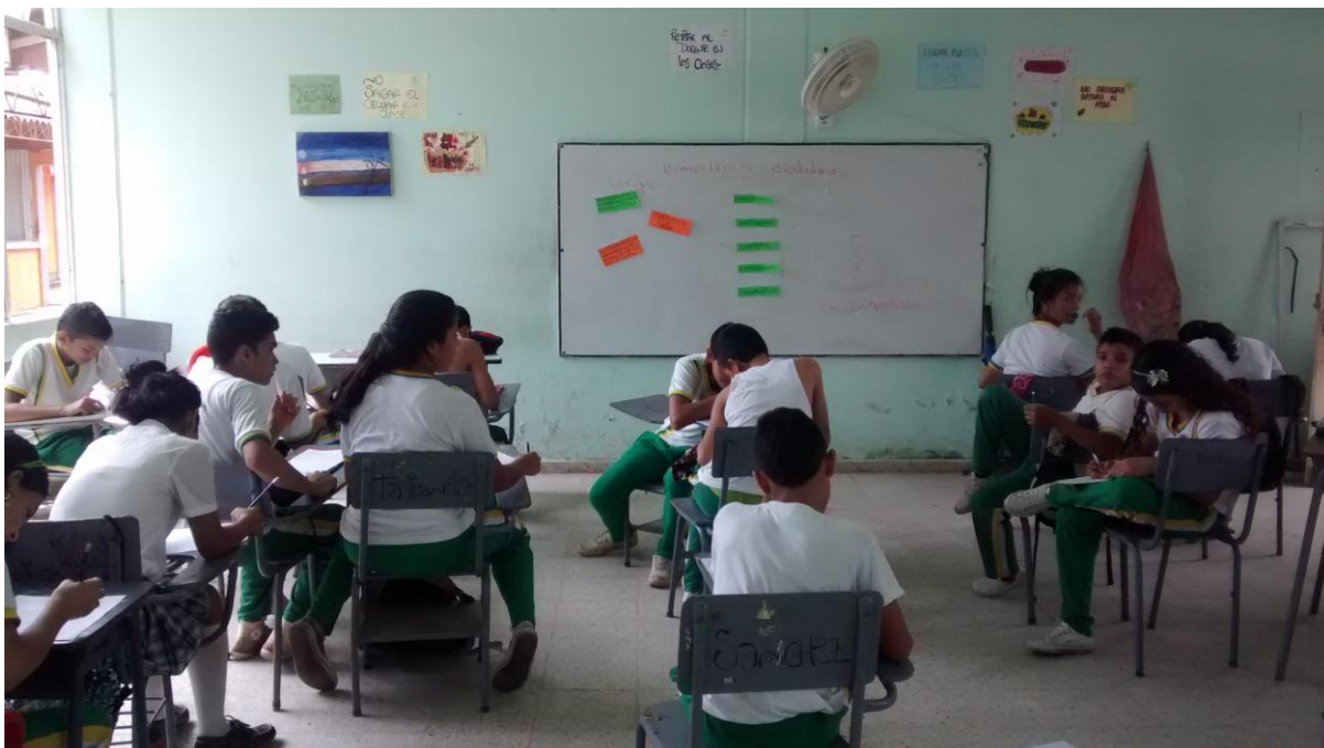
Anexo 16. Taller y aplicación de cuestionario sobre competencias ciudadanas dirigido a los alumnos del grado 7 de la Institución Educativa Celestino Mutis.