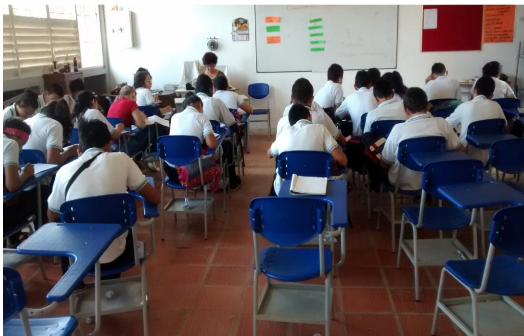
Anexo 18. Técnica de selección aleatoria, para aplicación de cuestionarios sobre competencias Ciudadanas