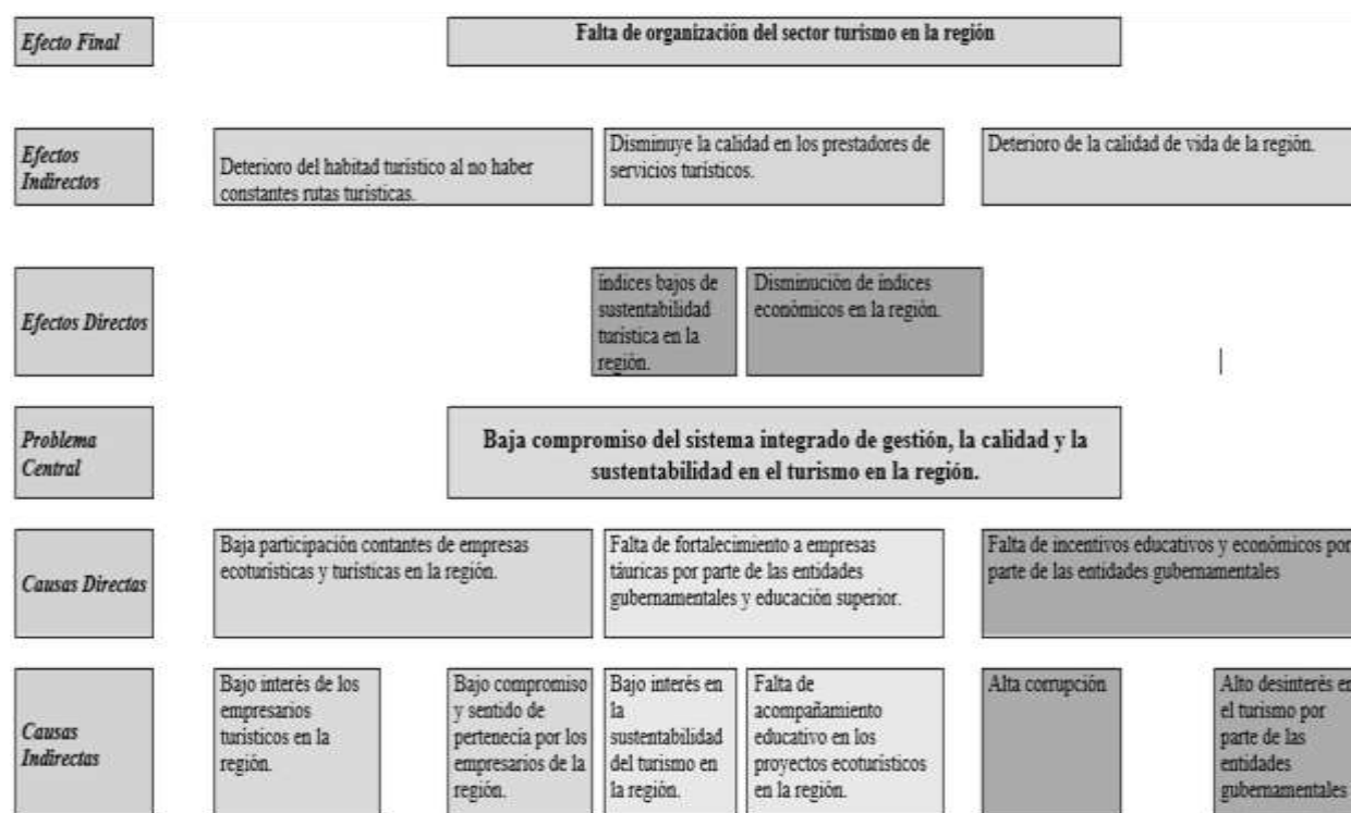
Árbol de problema de la empresa Misqua Caminos y Sentidos de los Andes