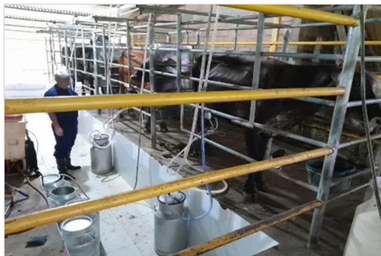
Figura 3. Suplementos concentrado en la Finca los guarataros.