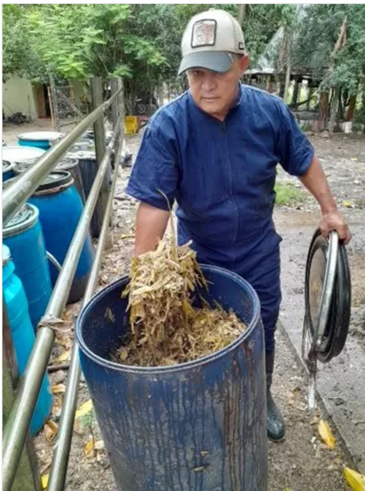
Figura 5. Comederos, saladeros y bebederos Finca los guarataros.