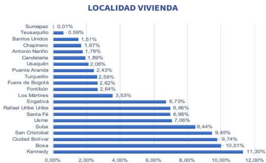
Tabla 4 Concentración significativa de Localidad de vivienda de vendedores y vendedoras informales IPES (2023)

Concentración significativa de Localidad de vivienda de vendedores y vendedoras informales IPES (2023)