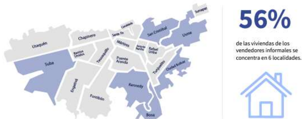
ANEXO A Concentración significativa de Localidad de vivienda de vendedores y vendedoras informales en 6 localidades de Bogotá. IPES (2023).

Concentración significativa de Localidad de vivienda de vendedores y vendedoras informales en 6 localidades de Bogotá. IPES (2023).