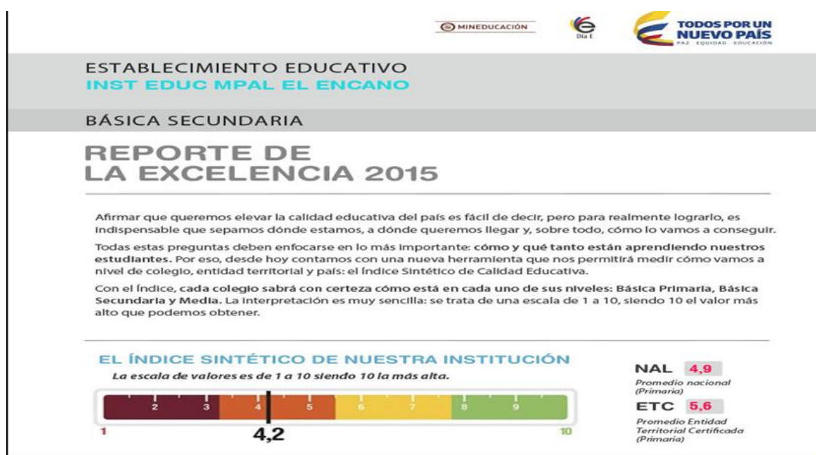
Figura 3 prueba saber 11 (ISCE 2014)

30%, nivel avanzado puntajes cercanos al máximo (400), oscilan entre 30,20% y 35,20%, en concreto 7 estudiantes logran un nivel avanzado aproximadamente, lejanos del puntaje máximo nacional, 32 estudiantes superan el puntaje mínimo de la prueba 250, de manera general sin importa la clasificación de la prueba y 38 estudiantes logran puntajes insuficientes, por tanto el impacto de la política Educativa de calidad en educación media para el año escolar 2014 es mínima, que se corrobora con el informe de índice sintético de calidad Educativa del ministerio de educación para este año escolar (ISCE 2014), donde ubica el desempeño de las pruebas saber en el nivel mínimo con un promedio de 5,2, distante del promedio nacional para este nivel de 5,5% y más aún del promedio de la entidad territorial Pasto de 6,0%.