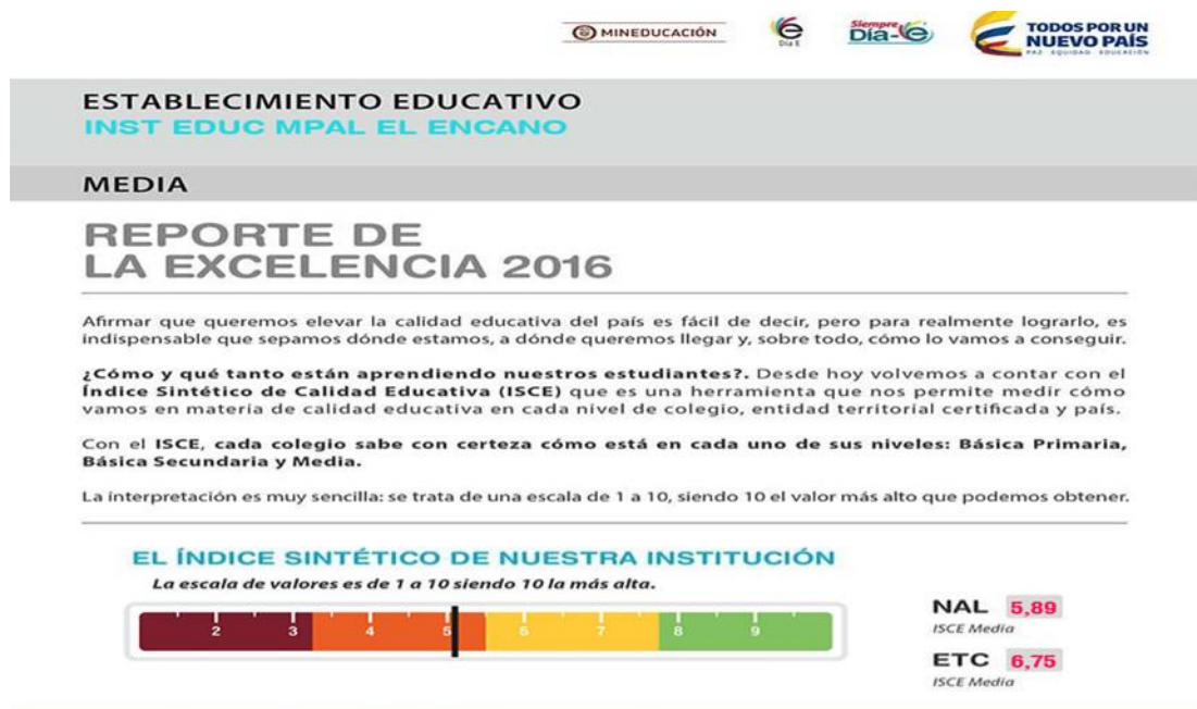
Figura 4 pruebas saber 11 2015

respecto al año anterior, se sigue presentando un alta promoción del 89% pero sin suficiente calidad